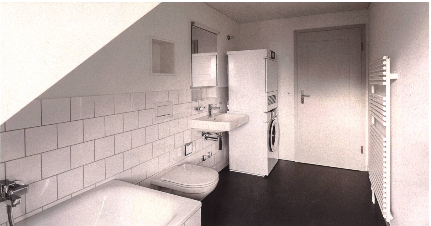
Immer mehr Gerätehersteller bieten ihre Haushaltgeräte zur Miete an. Mit einem gemieteten Waschturm stattet seit zwei Jahren auch die Wohnbaugenossenschaft 1904 St. Gallen die Wohnungen aus, die sie in der Siedlung Hagenbuch saniert.