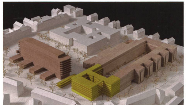
Bilder: Weyell Zipse Architekten / Kathrin Schulthess

In einer zweiten Bauetappe werden 2024 bis 2026 nochmals 70 bis 80 Wohnungen sowie Dienstleistungsflächen erstellt. wohnen&mehr lud fünf Architekten-teams zu einem Studienauftrag ein, den das Team Weyell Zipse Architekten aus Basel für sich entschieden hat. Es überzeugte mit dem Gesamtkonzept und einer hohen Effizienz und Wirtschaftlichkeit. Ein sechsgeschossiger Kopfbau an der Hegenheimerstrasse wird die Blockrandbebauung der ersten Etappe abschliessen und das neue «Eingangsgebäude» zum Westfeld bilden. Während das Erdgeschoss ganzflächig von Quartier- und Gewerbenutzungen belegt ist, darunter ein Kindergarten, gruppieren sich in den Obergeschossen die Wohnungen um einen kleinen erhöhten Wohnhof mit Dachgarten; dieser öffnet sich zu einer Grünpromenade und schafft so Licht und Luft. Vorgesehen sind ganz unterschiedliche Woh-