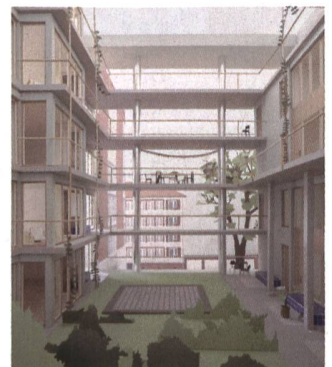
Der Kopfbau an der Hegenheimerstrasse wird die Blockrandbebauung abschliessen und einen eigenen erhöhten Innenhof bilden.

nungen, von Studios bis Maisonetten, die das vorhandene Angebot auf dem Westfeld gut ergänzen. Erschlossen werden sie über den Hof mit zwei Treppenhäusern und Laubengängen in den oberen Stockwerken. Ein filigraner zweigeschossiger Pavillon zwischen dem Schiff und den Neubauten wird zudem zahlreiche Veloabstellplätze bieten.