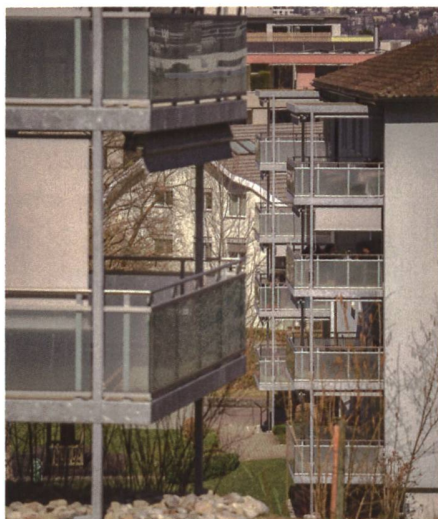
Referenzobjekt Kriens – Total 150 Balkone.

Nebst Beratung und Ausführung bietet die Wasta AG weitreichende Dienstleistungen wie Bewilligungseingaben, Bauleitungsaufgaben und vieles mehr an.