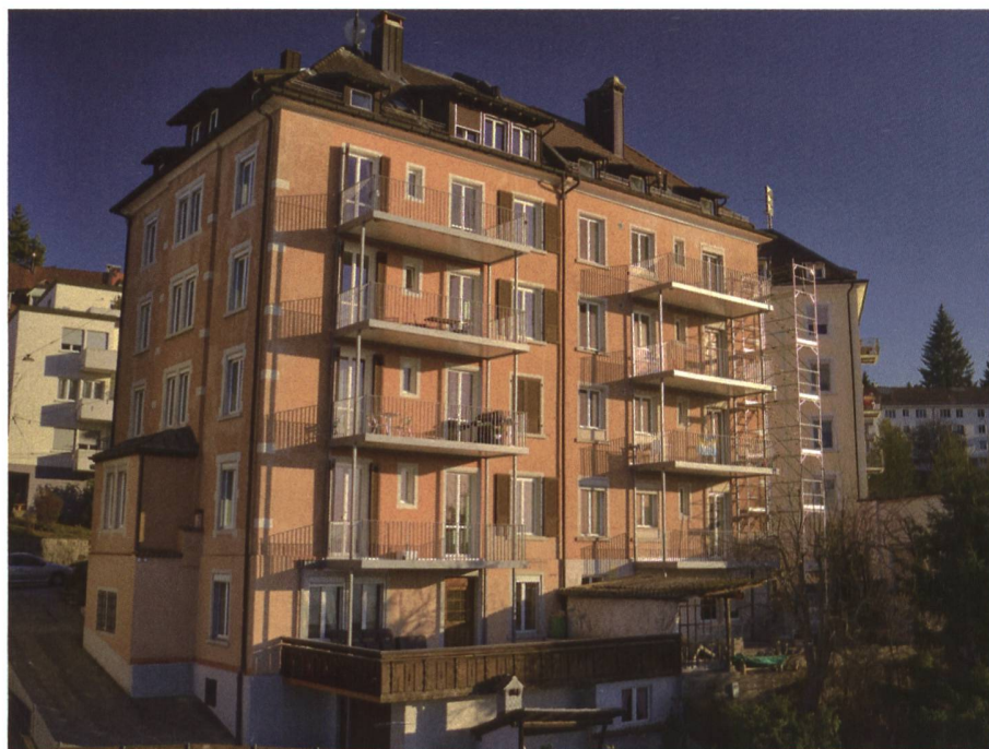
Referenzobjekt St. Gallen – Total 8 Balkone.

Das mit langjähriger Erfahrung entwickelte Konzept besticht durch innovative Lösungen. Dazu gehört unter anderem das intelligente Entwässerungssys-