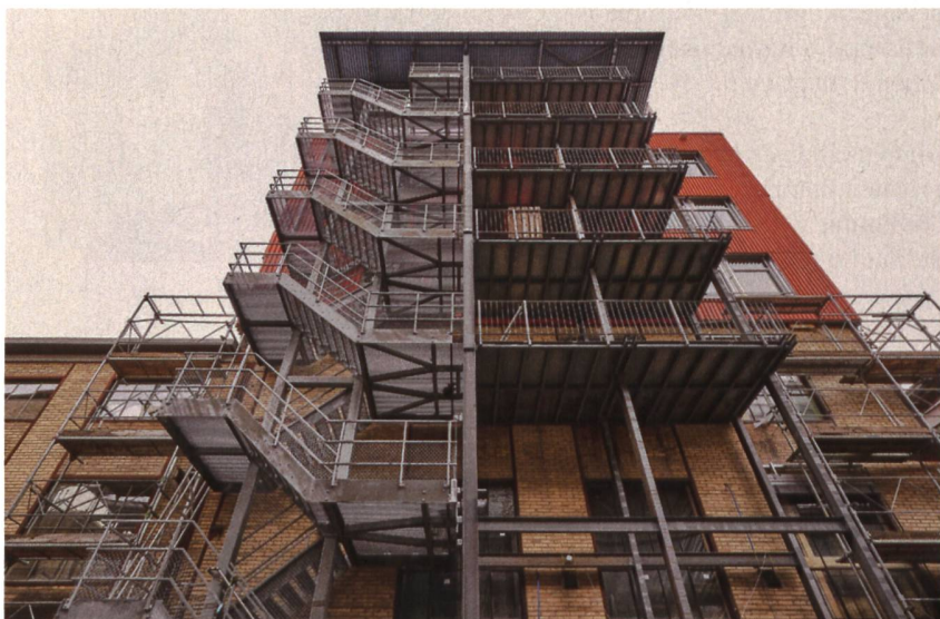
Für die Halle 118 wurden diverse Teile aus anderen Gebäuden wiederverwendet, zum Beispiel ein Stahlskelett als Tragestruktur, die Stahlaussentreppe oder Aluminiumfenster. Die Plattenbeläge sind aus alten Granitfassaden hergestellt. Beton wurde nur eingesetzt, wo er statisch oder für Schall- und Brandschutz unvermeidlich war, im Übrigen kamen Holz, eine Dämmung aus Strohhallen und Lehm aus dem örtlichen Aushub zum Einsatz.

Ja, da besteht tatsächlich eine Lücke, die erst jetzt breiter thematisiert wird. Ein Stück weit erklärt sich das wohl auch, weil es schwierig ist, graue Energie zu messen. Von einem Gebäude im Betrieb weiss man genau, wieviel es verbraucht. Will man aber eine Gesamtbilanz über die Lebensdauer eines Hauses erstellen, wird es komplex. Beispielsweise muss die Herkunft der Materialien berücksichtigt werden. Es macht einen riesigen Unterschied, ob verbautes Holz aus der Region oder aus dem fer-