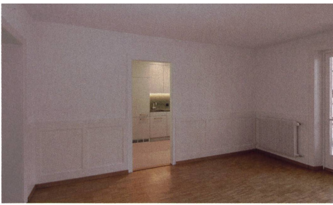
Grundrissveränderungen wurden keine vorgenommen. Aber dank neuen Balkonen mit Flügeltüren fällt mehr Licht in die Wohnungen.