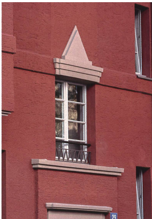
Zum Innenhof hin sind grosse Balkone entstanden. Die strassenseitig vorhandenen Balkone wurden nicht verändert, weil die Fassade aus denkmalpflegerischen Gründen nicht gedämmt werden durfte.