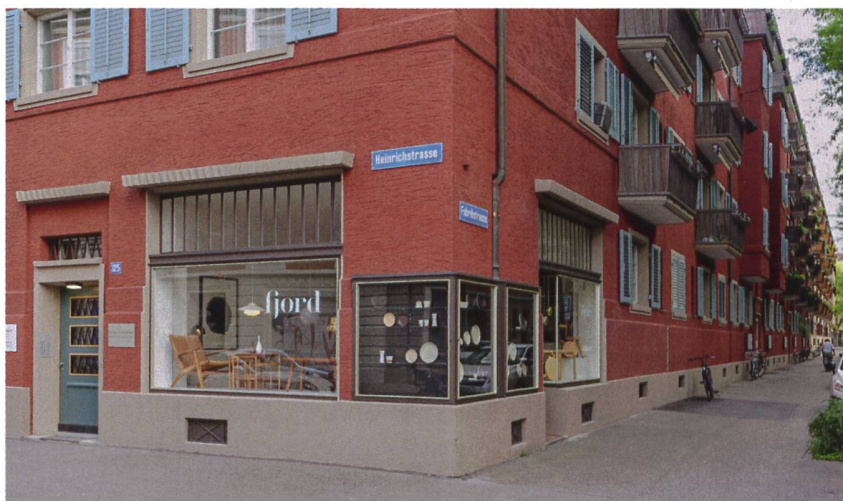
Zum denkmalgeschützten Gebäudekomplex mit elf Hauseingängen und 104 Wohnungen gehören auch eine Arztpraxis und ein Ladenlokal.

Aktuell werden noch letzte Arbeiten im Aussenbereich vorgenommen: Die Umgebung wird erneuert, zusätzlich gibt es mehr Veloab-