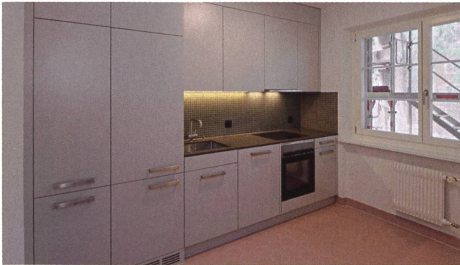
In den neuen Küchen gibt es mehr Stauraum als früher. Der Plattenboden aus rosaroten Keramikfliesen passt zum historischen Gebäude.