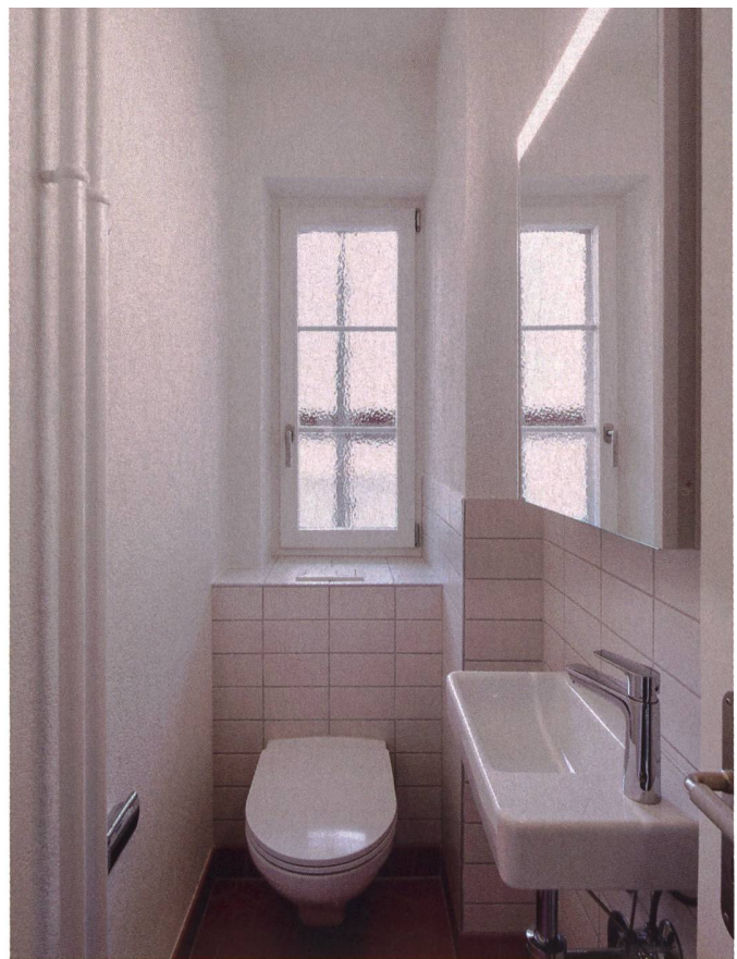
Auch in den Badezimmern setzte man beim Boden auf rosa Sechseckfliesen. In einigen Wohnungen ersetzen Duschen die Badewannen.

gleich Badezimmer und Küchen an», führt Ocak aus. 30 Jahre sind seit der letzten Renovation vergangen, und schon länger war klar, dass die nächste anstand. Die GBRZ veröffentlicht jeweils im Jahresbericht ein Investitionsprogramm über 25 Jahre mit den vorgesehenen baulichen Eingriffen in ihren Siedlungen. Entsprechend wussten die Genossenschafterinnen und Genossenschafter Jahre zuvor, dass eine grosszyklische Sanierung auf sie zukommt. Im Sommer 2018 wurde schliesslich das Baugesuch eingereicht, im gleichen Jahr fand die detaillierte Mieterinformation statt.