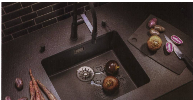
Die neuen Granitbecken von Suter Inox bestehen zum grössten Teil aus Quarz, dem härtesten Bestandteil von Granit.