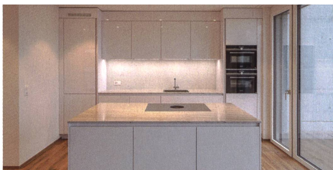
Werden bei der Hans Eisenring AG immer öfter nachgefragt: Küchenfronten ohne Griffe.