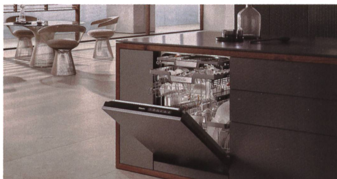
Die Geräte der G 7000-Linie von Miele sind mit einem Dosiersystem ausgestattet. Wird dieses ausgewählt, verbraucht das Gerät nur so viel Spülmittel wie nötig.

wenn die Kochzonen ausgeschaltet sind, selbständig in den Nachlauf, bevor er ganz ausschaltet. Das Einströmgitter und der Fettfilter sind bei den neuen Kochfeldabsaugungen leicht von oben zu entnehmen.