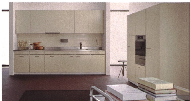
Die einzelnen Bestandteile einer Forster-Küche können am Lebensende wieder dem Kreislauf zugeführt werden.

lich die Qual der Wahl. Seit 1953 wird in Arbon am Bodensee die Forster-Stahlküche produziert. Heute heisst das Unternehmen Forster Swiss Home AG und produziert bis auf wenige Elemente noch immer in der Schweiz. Mit dem Material Stahl hebt sich Forster klar von anderen Küchenanbietern ab. Die Küchen gelten als besonders robust und langlebig.