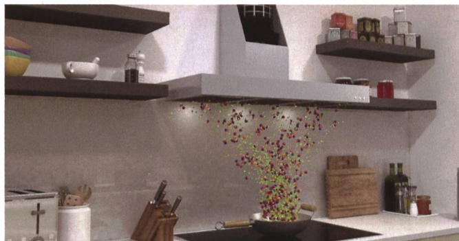
Die Chuchi Arena setzt mit dem Technologie-Partner Avitana auf Plasmafilter-Systeme, die nach dem Einbau nie ausgetauscht werden müssen.