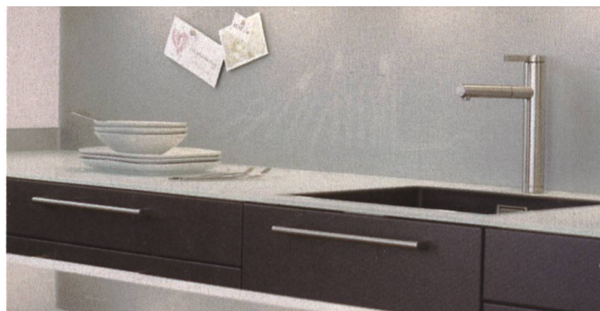
Gegen vielerlei Einflüsse völlig unempfindlich: Die Küchenrückwand Swissboard von Sanitas Trösch.