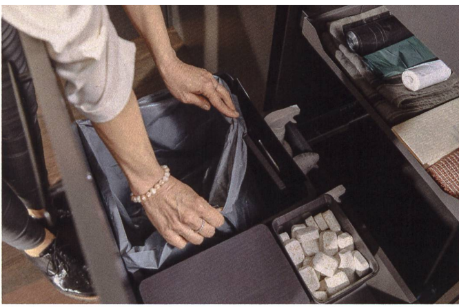
Peka-Trennsysteme: Sämtliche Kunststoffteile sind bei mittlerer Temperatur spülmaschinenfest.