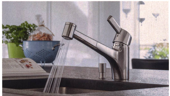
Die eingebaute Steuerpatrone sorgt für eine deutliche Reduktion des Wasser- und Energieverbrauchs der Laufen-Armatur.

milienunternehmen Suter Inox . In den Fabrikationshallen wird ausschliesslich der Edelstahl 18/10 von europäischen Produzenten verwendet. Stahl in dieser Qualität ist korrosionsbeständig und das Material praktisch geschmacksneutral. Ganz neu im Sortiment des Küchenausstatters ist eine Quarzspüle aus der Modellreihe Daneo. Auch dieses Material zeigt wie Stahl kaum Belastungsspuren und gibt keine Gerüche weiter. Suter Inox entwickelte die dunkle Spüle in Zusammenarbeit mit der deutschen Schock GmbH und bietet das Becken in den Formaten 45 und 55 an.