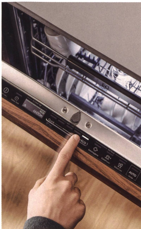
Geschirrspüler mit QuickSelect-Funktion von Electrolux zeigen an, ob ein ökologisches Programm gewählt wurde.