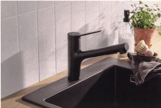
Der reduzierte Materialeinsatz für Zesis M33 von Hansgrohe spiegelt sich auch in einem günstigen Preis.