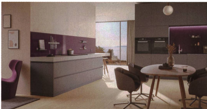
Wilhelm Schmidlin gewährt 30 Jahre Fabrikationsgarantie auf die Küchenrückwand aus Stahl und Email, die zu 100 Prozent recycelbar ist.