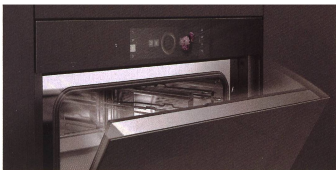
Einfache und exakte Bedienung: Backöfen und Steamer der V-Zug-Excellence-Linie überraschen mit einem besonders grossen Display.