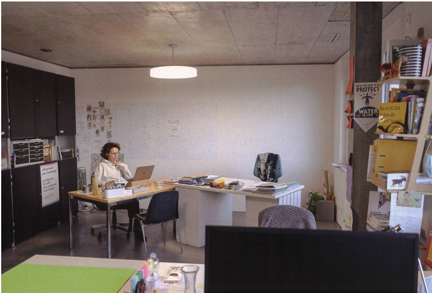
Die Genossenschaft Kalkbreite bietet aus Überzeugung Coworking Spaces in ihren beiden Überbauungen an (auf dem Bild: Arbeitsraum in der Kalkbreite). Sie müssen im Moment nicht zwingend kostendeckend sein.

Wohnen und Arbeiten wird auch in Genossenschaftsüberbauungen zum Thema