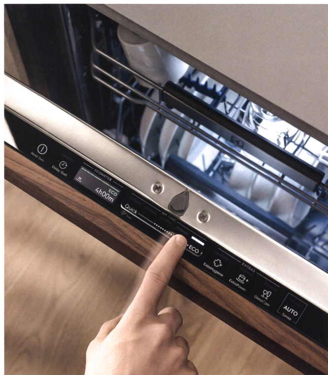
Laufzeit des Spülprogramms bequem per Schieberegler einstellen und Ökologie-Level am Display ablesen.