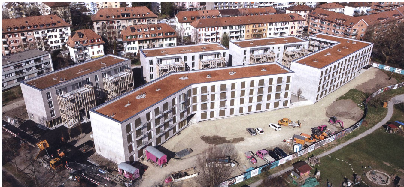
Die fünf Gebäude der Huebergass sind dicht gebaut und bilden zusammen eine innenhofartige Gasse.