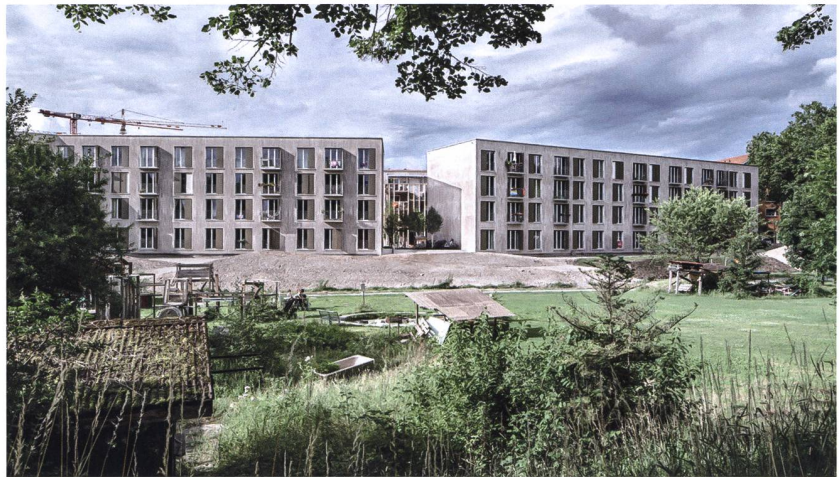
Die Huebergass-Überbauung ist auf einem Schrebergartenareal entstanden. Ab 2022 realisiert die Stadt gleich angrenzend einen Park.

WBG Huebergass, unterschrieb den Totalunternehmensvertrag mit der Halter AG und brachte 20 Prozent Eigenkapital ein, rund 80 Prozent sind fremdfinanziert.