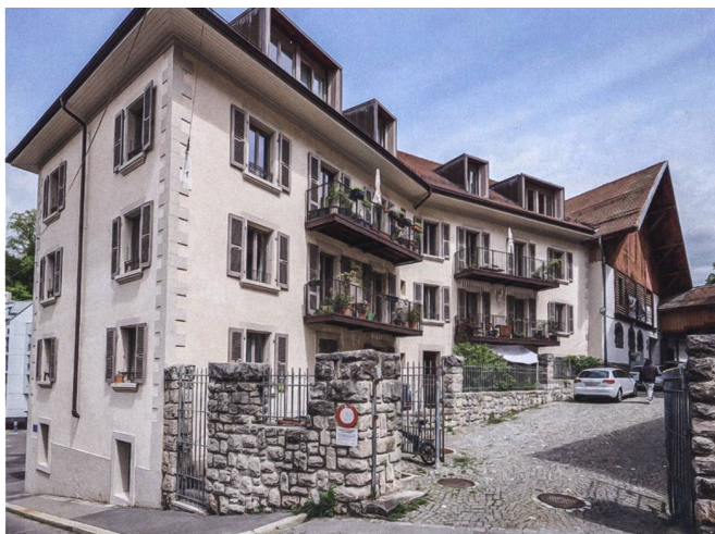
Die Fassade des historischen Gebäudes wurde in den Originalzustand zurückversetzt. Im Inneren bietet es heute modernen Wohnkomfort.

freundeten Parteien, die – jede für sich – seit längerem auf der Suche nach bezahlbarem Wohnraum in Lausanne waren und die Vision vom genossenschaftlichen, klimafreundlichen und urbanen Wohnen teilten. Die Mitglieder, darunter auch Architekten, erarbeiteten gemeinsam ein Vorprojekt. Bewertet wurden die Kriterien Energieeffizienz, Erhaltung der bauhistorischen Bedeutung, nachhaltige