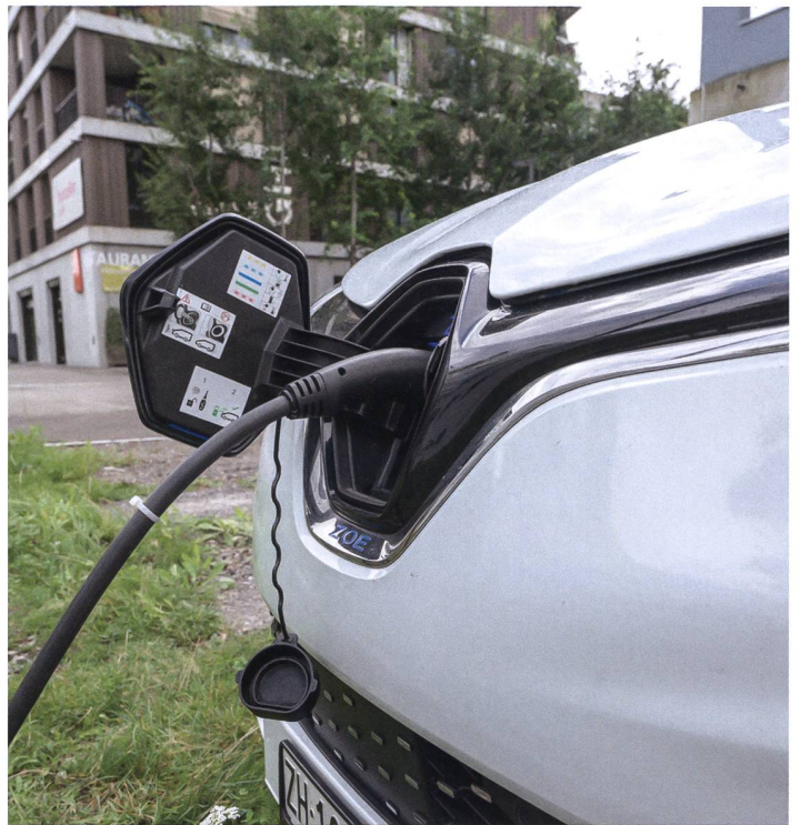
Getankt werden die beiden Fahrzeuge an der Areal-eigenen Ladestation.

Das Unternehmen edrive carsharing AG wurde von der LANDI Luzern West als Startup gegründet und hat sich zum Ziel gesetzt, die Mobilität nachhaltiger zu gestalten. Die Fahrzeugflotte besteht aus 100 Prozent solarstrombetriebenen Elektrofahrzeugen. edrive carsharing verteilt den Verbrauch eines Fahrzeugs auf mehr Nutzungen, reduziert Fahrzeugbestände und Verkehr, sorgt für mehr Platz und Gesundheit für Mensch und Natur.