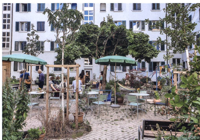
Wo früher ein wenig attraktiver Hof kaum genutzt wurde, sorgen heute eine neue Möblierung, Pflanzbeete und neue Bäume für buntes Leben – nicht nur wie hier am Siedlungsfest.