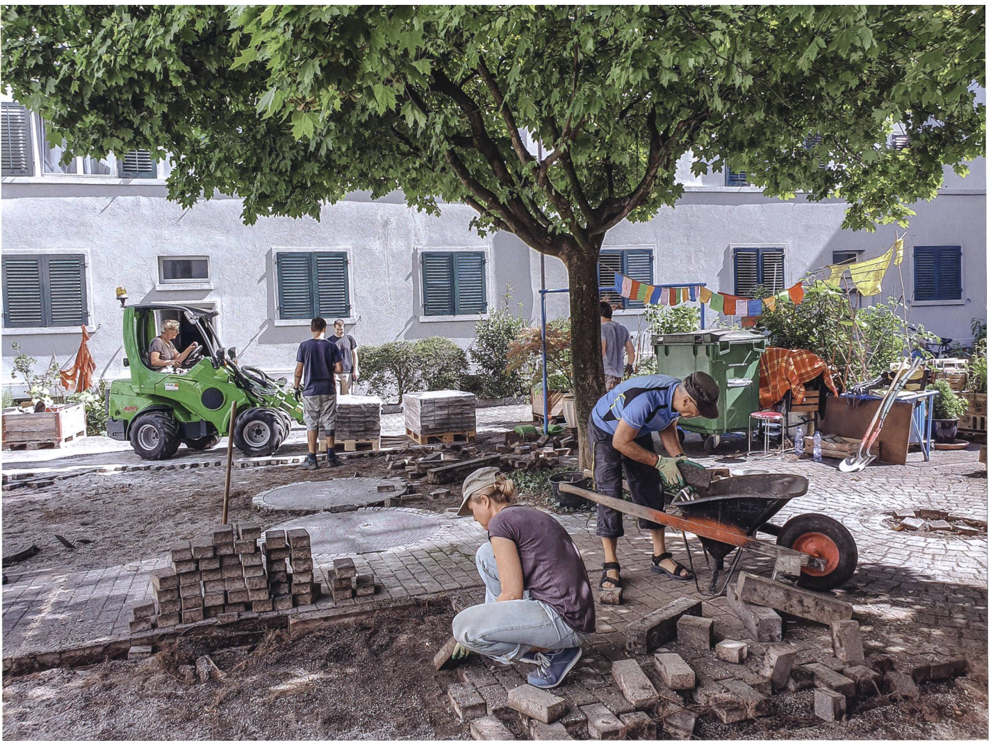
Bewohnerinnen und Bewohner der GBMZ wollten mehr Begegnungen – und mehr Natur. Sie haben ihren Innenhof deshalb schrittweise umgestaltet und zum Beispiel einen Teil der Verbundsteine durch einen offenen Boden ersetzt, der Lebensräume für Insekten bietet.

So setzen Baugenossenschaften naturnahe Aussenräume zusammen mit Bewohnenden um