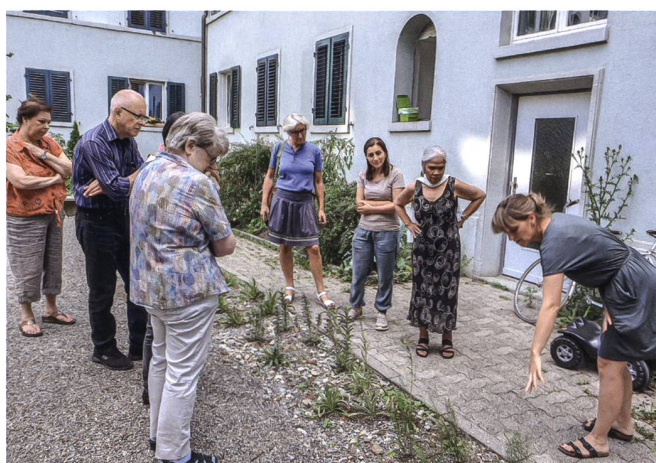
Eine Biologin und eine Landschaftsgärtnerin begleiteten die Umsetzung. Diesen Sommer informierten sie an Führungen über die neue Bepflanzung, welche die Biodiversität fördert.