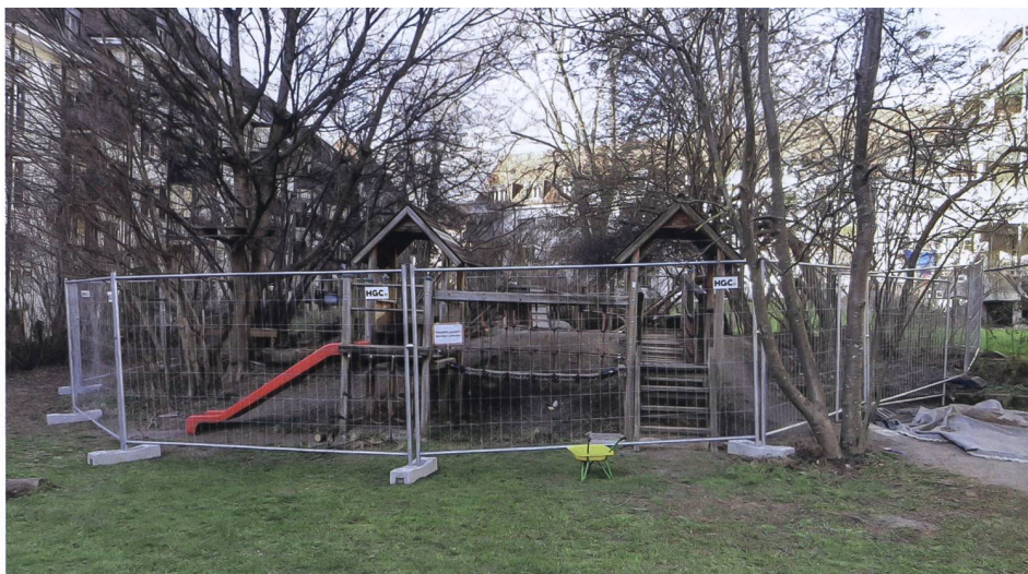
Im Frühling wurde die ganze Anlage zum Leidwesen der Kinder vorübergehend abgesperrt, wobei auch der nicht beanstandete Teil mit Türmen und Kletternetzen betroffen war.

Im Spannungsfeld zwischen attraktiven Spielplätzen und Sicherheitsdenken ist es nicht immer einfach, den richtigen Weg zu finden. «Das Sicherheitsbewusstsein hat sich stark verändert», sagt Hochstrasser. Er war über Jahre bei