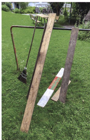
Nicht nur der Spielplatz selbst, sondern auch die nötigen Kontrollen beschäftigen die Genossenschaft Freiblick (im Bild: liegen gebliebene Bretter). Künftig sollen die Eltern Mitverantwortung übernehmen. Dazu läuft aktuell ein Mitwirkungsprozess.

oder auch spitze vorstehende Äste und Zweige wirken auf den ersten Blick nicht sonderlich gefährlich. Falls aber ein Kind von der Hütte stürzen sollte, könnten spitze Gegenstände im Fallraum ernste Verletzungen verursachen. Bei der Holzhütte war nicht deren Höhe Anlass für Beanstandungen. Im Einzelnen kommt es darauf an, ob das Dach für Kleinkinder zugänglich ist und wie der sogenannte Fallraum rundherum aussieht.