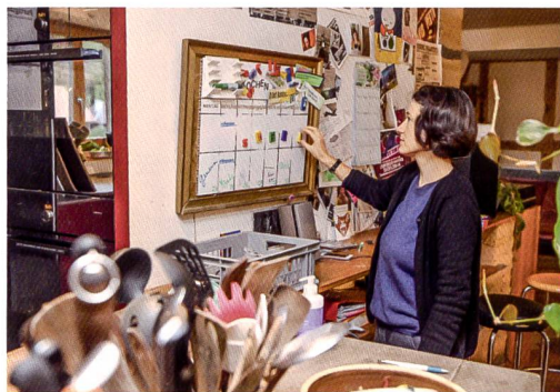
19 Bewohnerinnen und Bewohner leben in der Genossenschaft. Es gibt einen Koch- und einen Putzplan, ansonsten vor allem: viel Freiraum.