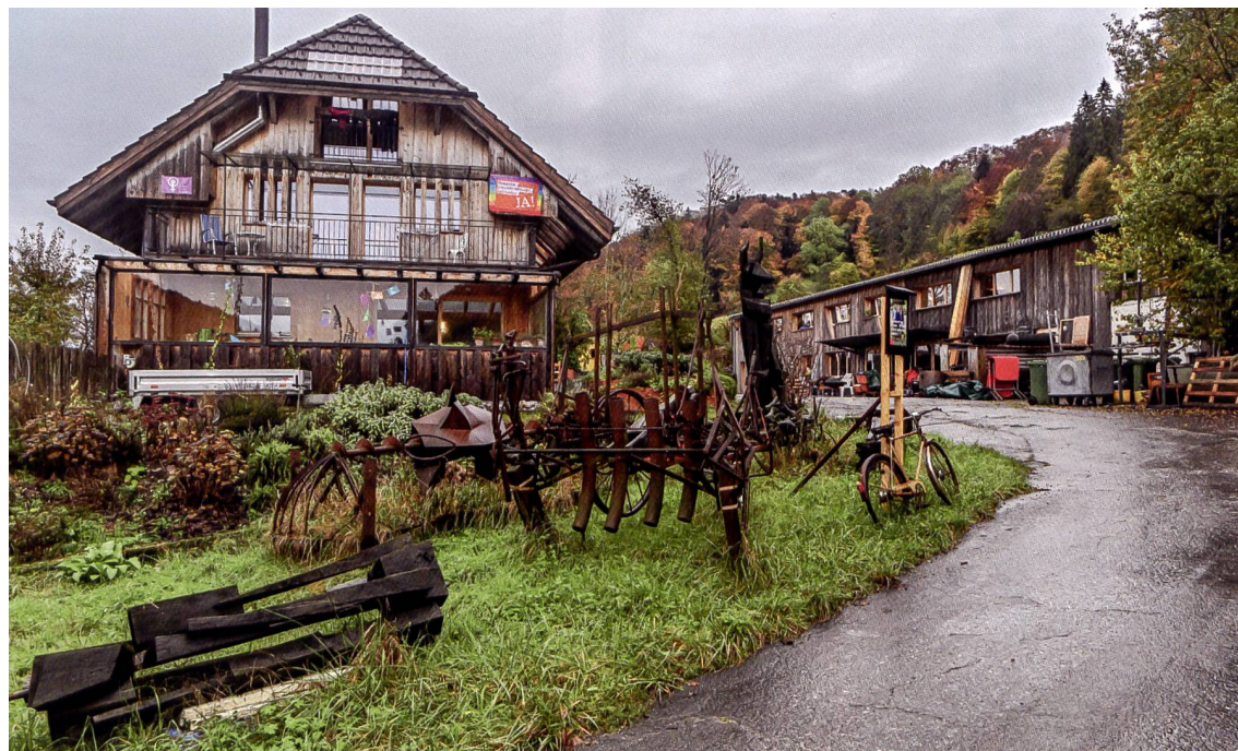
Vor über zehn Jahren hat die Genossenschaft das alte Bauernhaus samt Lagerhaus im Köniztal gefunden und für diverse Nutzungen umgebaut.