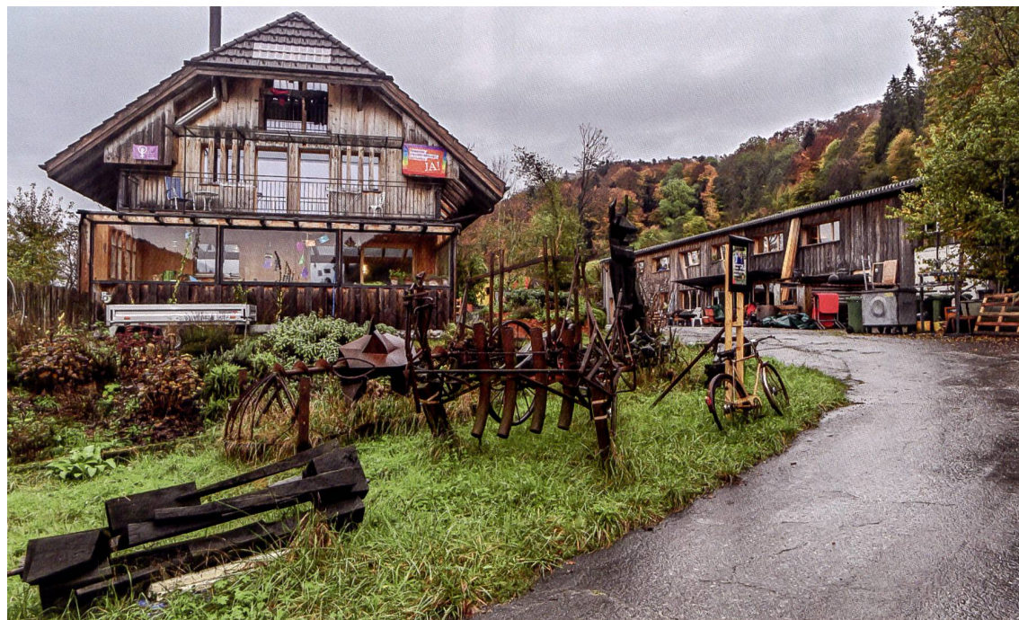
Vor über zehn Jahren hat die Genossenschaft das alte Bauernhaus samt Lagerhaus im Köniztal gefunden und für diverse Nutzungen umgebaut.