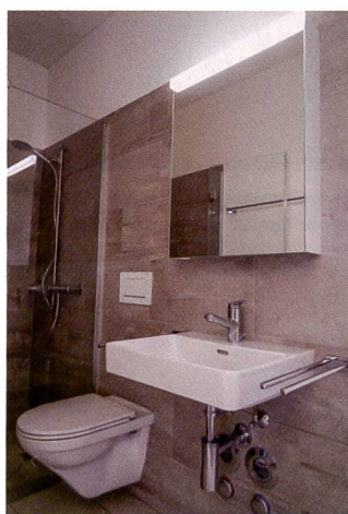
Während Wände und Boden in den Badezimmern mit Keramikplatten ausgestattet sind, findet sich in allen anderen Räumen ein versiegeltes Eichenparkett.