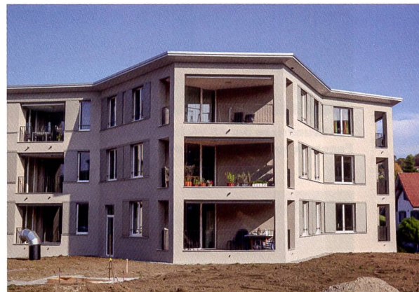
Die Wohnungen unterscheiden sich auch in Bezug auf die privaten Aussenräume.