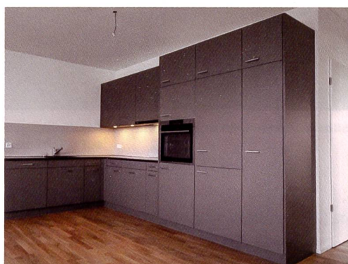
Die Küchen sind mit Induktionskochherd, teilweise mit Kombisteamer und jeweils mit viel Stauraum ausgestattet.