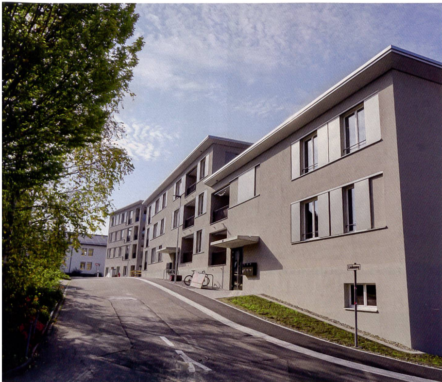
Blick auf die Eingangsseite.