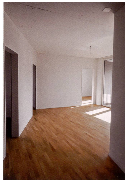
Die Grundrisse der 48 Wohnungen sind allesamt unterschiedlich. Teilweise bietet sich den Bewohnerinnen und Bewohnern aus den grossen Fenstern ein Ausblick auf den Untersee.