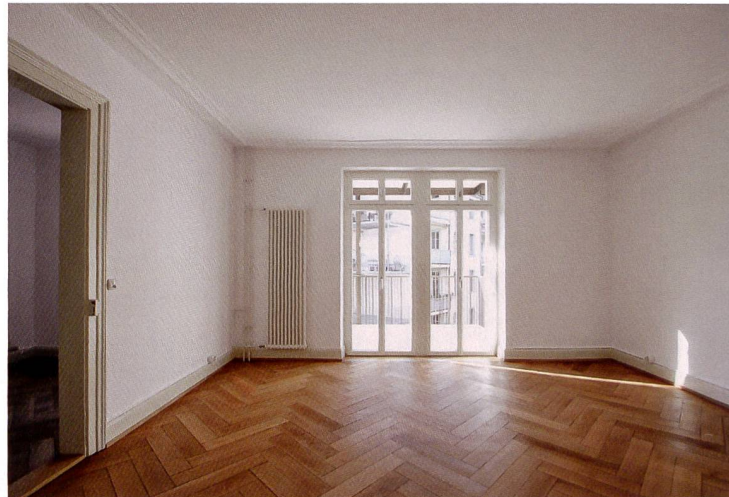
Die 48 Wohnungen wurden rundum erneuert. Auf Grundrissveränderungen oder einen Lifteinbau verzichtete man und hielt damit die Mietzinse tief.