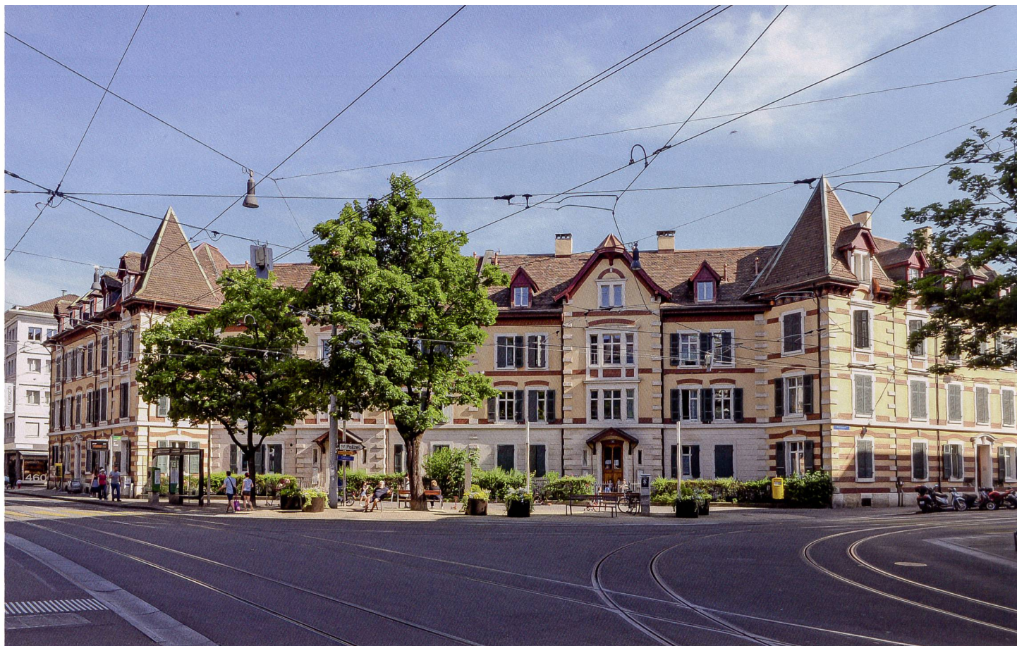
Die Siedlung der Gewona Nord-West mit Baujahr 1892 prägt den Tellplatz im Basler Gundeldingerquartier.

Gewona Nord-West erneuert Siedlung Tellplatz, Basel