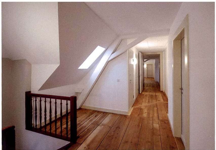
Einen Teil der Mansarden legte man zu 1-Zimmer-Studios zusammen (unten). Das obere Bild zeigt die Erschliessung der Mansarden und Studios.

«Wir sind froh, dass wir den engen Zeitplan trotz Coronapandemie einhalten konnten»,