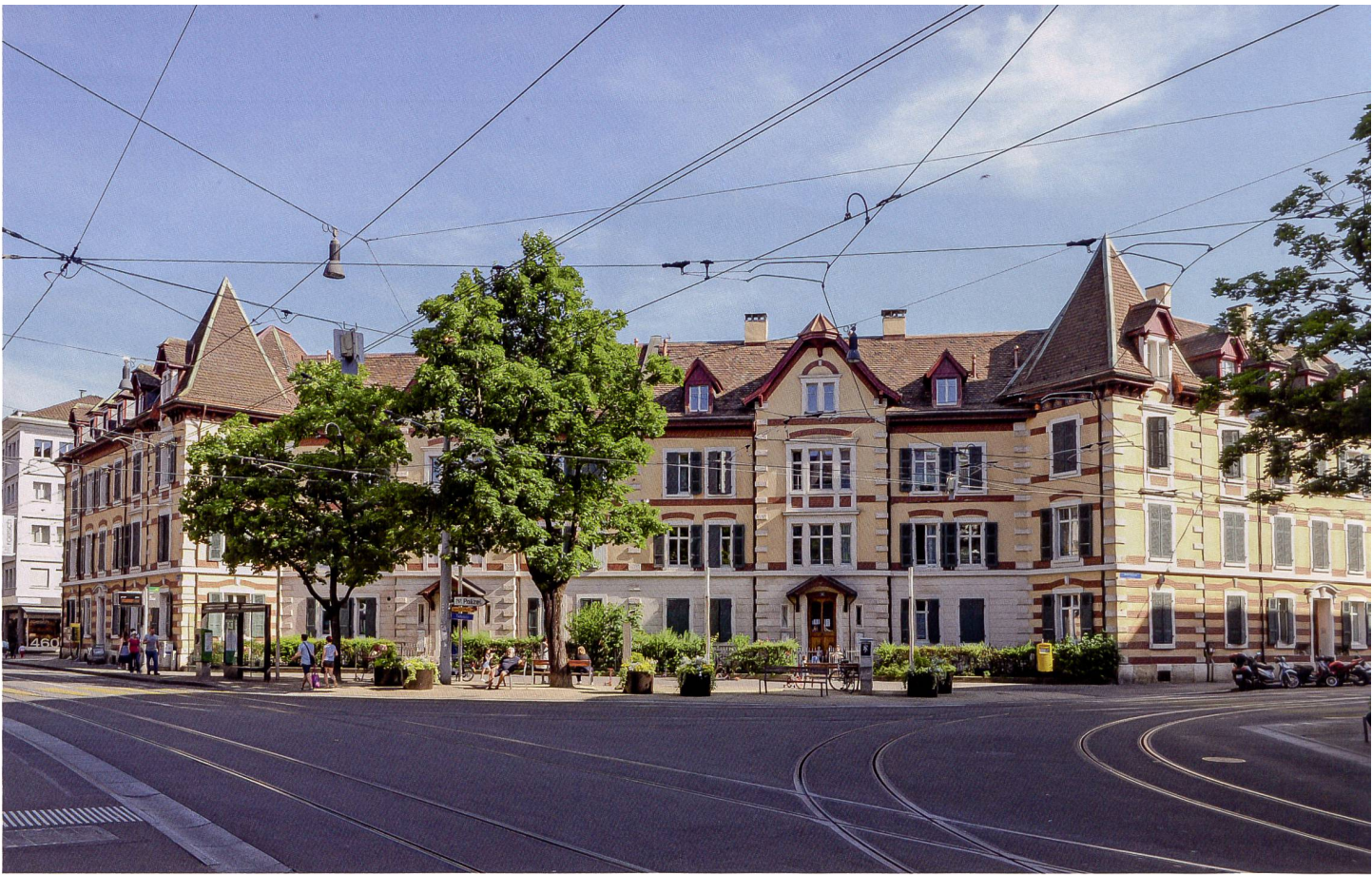
Die Siedlung der Gewona Nord-West mit Baujahr 1892 prägt den Tellplatz im Basler Gundeldingerquartier.

Gewona Nord-West erneuert Siedlung Tellplatz, Basel