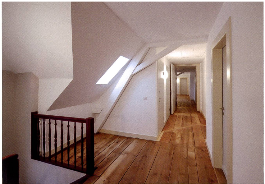
Einen Teil der Mansarden legte man zu 1-Zimmer-Studios zusammen (unten). Das obere Bild zeigt die Erschliessung der Mansarden und Studios.

«Wir sind froh, dass wir den engen Zeitplan trotz Coronapandemie einhalten konnten»,