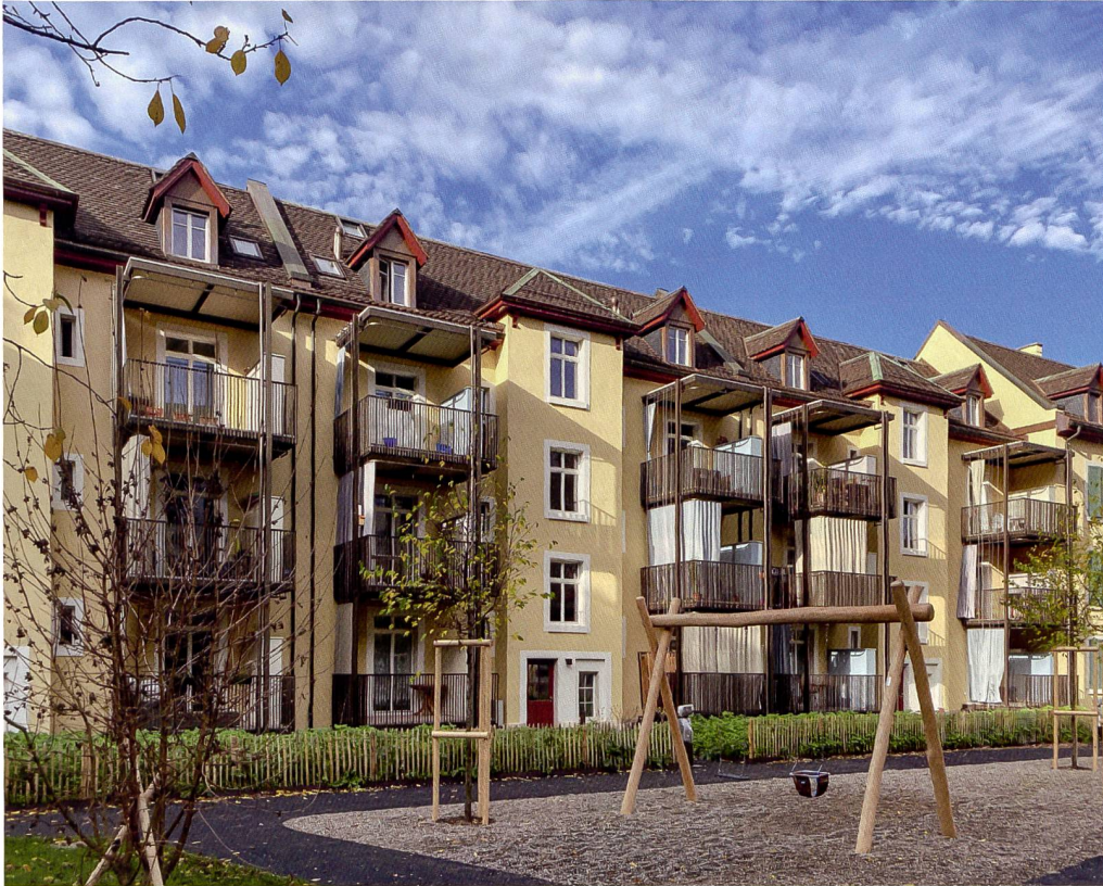
Bilder: Guido Köhler