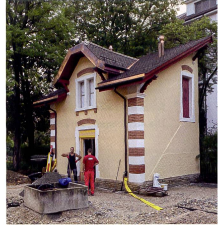
Das ehemalige Waschhaus können die Bewohnerinnen und Bewohner nach dem Einbau von Küche und Toilette als Treffpunkt für private Anlässe nutzen.

mit den Umgebungsarbeiten abgeschlossen wurde, holte die Baugenossenschaft dies nun nach – und das ohne Kündigungen: Die Mieterinnen und Mieter zogen während der zwei- bis dreimonatigen Wohnungssanierung in Rochadewohnungen.