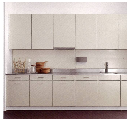
Stahl bleibt unerreichbar, wenn es um Nachhaltigkeit und Ästhetik geht.

Der konsequent grüne Grundgedanke zeigt sich auch im Innern des Produktionsbetriebs. Hier säumen kleine Bäumchen die Allee entlang der Produktionsstationen, die Halle wirkt insgesamt hell und freundlich. Die grosse Stanzmaschine