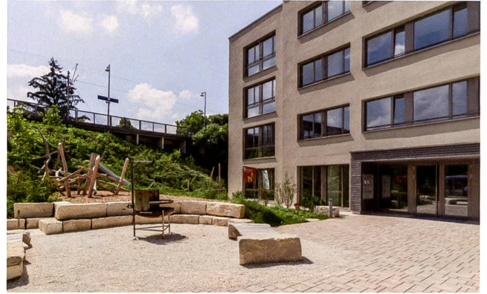
Der Aussenraum ist auf Gemeinschaftlichkeit ausgelegt.