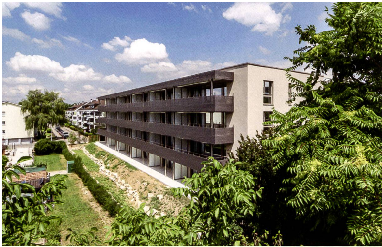
Gartenseite mit Balkonfront.