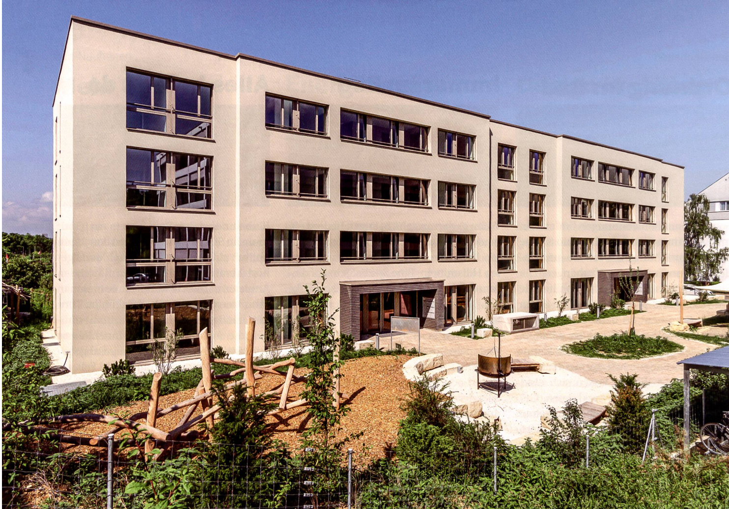
Blick auf den Eingangsbereich direkt bei der S-Bahn-Station Niederholz.

Bau- und Wohngenossenschaft Höflirain in Riehen (BS) erstellt Neubau