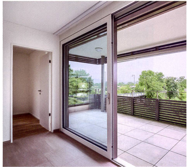
Die Wohnungen bieten einen überdurchschnittlichen Ausbaustandard.

5 ½-Zimmer-Wohnungen. Man habe immer wieder gehört, dass in der Region grössere Familienwohnungen fehlen würden und habe sich deshalb für den 5 ½-Zimmer-Typ entschieden.