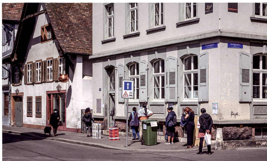
In den Kleinbasler Caritas-Markt kommen nun vermehrt auch Frauen und Männer, die es bisher ohne Unterstützung geschafft haben. Die Preise sind im Schnitt halb so hoch wie im Detailhandel.