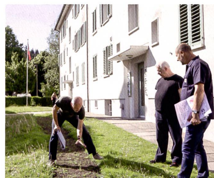
Einen guten Monat nach der Aussaat sehen die künftigen Blumenstreifen noch dürrtig aus. Viele Wildblumen keimen erst nach dem ersten Überwintern. Links: Anlegen der Blumenstreifen.