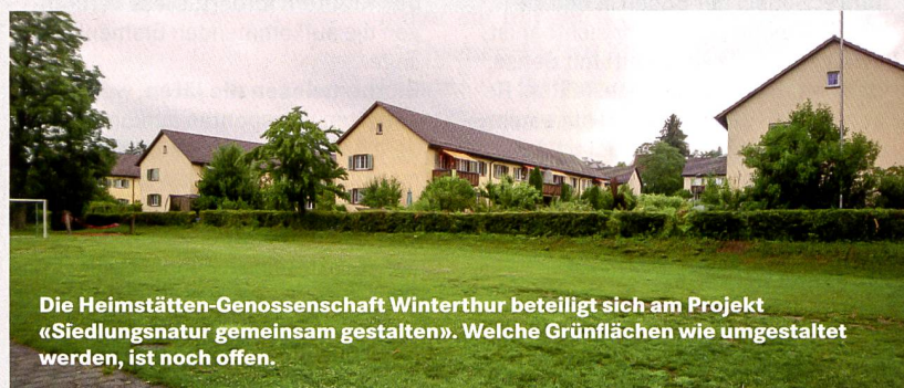
Die Heimstätten-Genossenschaft Winterthur beteiligt sich am Projekt «Siedlungsnatur gemeinsam gestalten». Welche Grünflächen wie umgestaltet werden, ist noch offen.