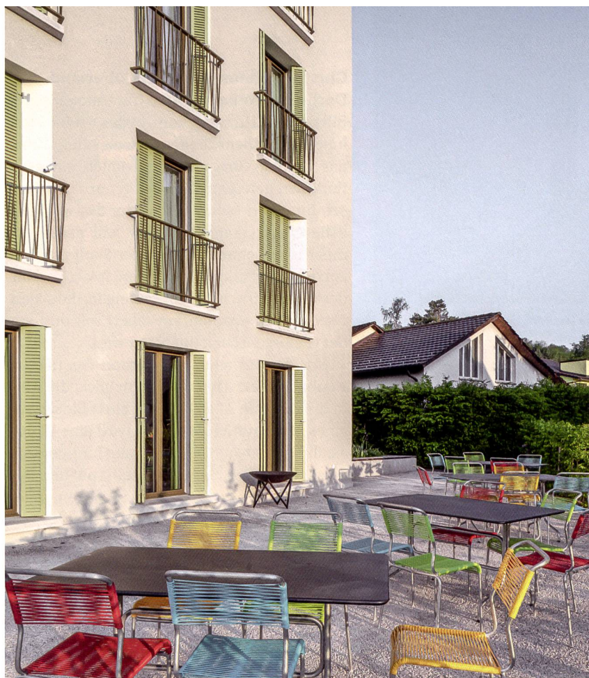
Blick auf die Gartenseite: Hier profitieren die Parterrewohnungen von Sitzplätzen, dazu gibt es ein kleines Wegnetz und einen Siedlungsplatz.