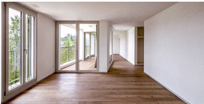
Die Wohnungsgrundrisse bilden eine offene und fliessende Raumfigur für Küche, Essen und Wohnen und verzichten auf unnötige Zirkulationsflächen.