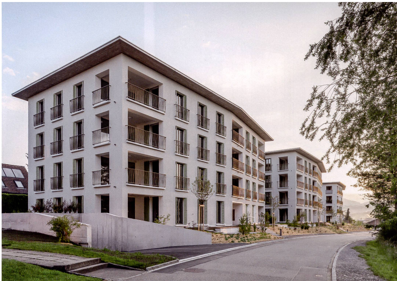
Bilder: Radek Brunecky

Das ausladende Dach und die französischen Fenster bestimmen das Erscheinungsbild der drei Neubauten.