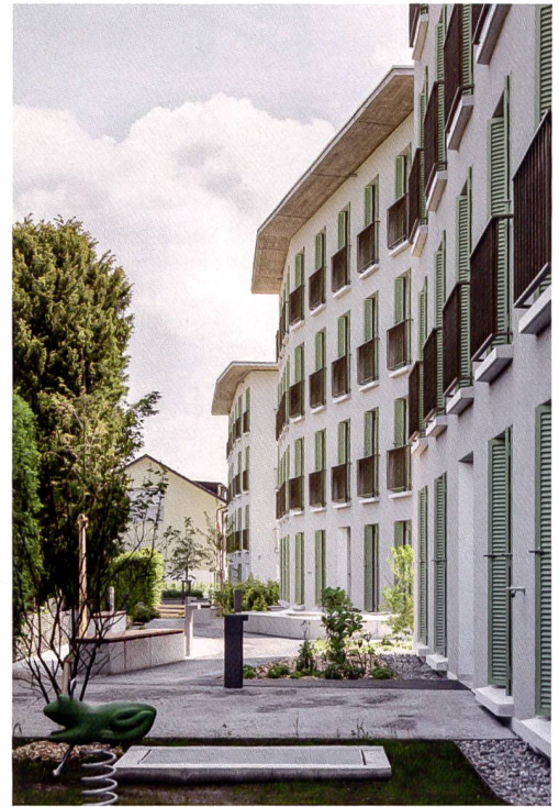
Blick auf die Gartenseite: Hier profitieren die Parterrewohnungen von Sitzplätzen, dazu gibt es ein kleines Wegnetz und einen Siedlungsplatz.

stab der benachbarten Umgebung auf. Die leicht geknickten Längsfassaden, die ausladenden Dächer und besonders das Spiel der französischen Fenster und der raumhohen Fensterläden bestimmen das Bild und schaffen gemäss Wettbewerbsjury ein beinahe mediterranes, wohnliches Ambiente.