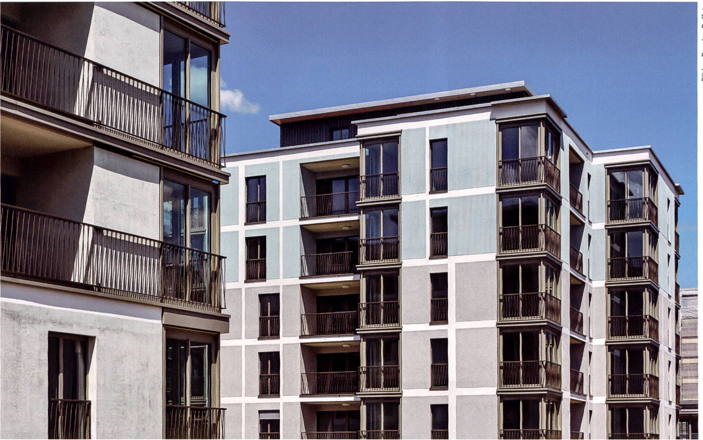
Duplex Architekten entwarfen für die fünf Häuser der BEP und die zwei Häuser der Sammelstiftung Nest ein einheitliches Erscheinungsbild.