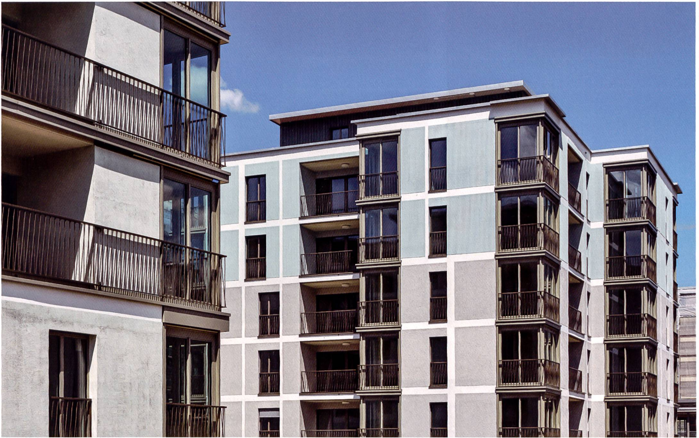
Duplex Architekten entwarfen für die fünf Häuser der BEP und die zwei Häuser der Sammelstiftung Nest ein einheitliches Erscheinungsbild.