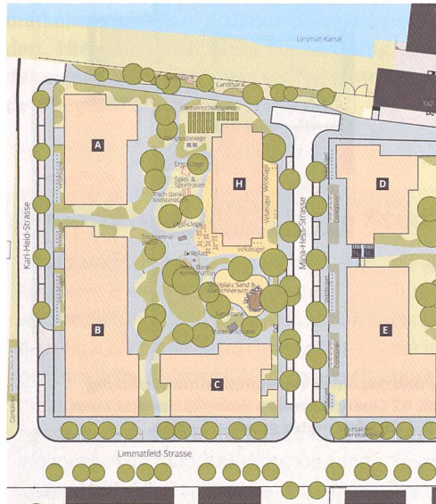
Situationsplan des BEP-Teils der Siedlung Limmatfeld. Gebäude H ist das Gemeinschaftshaus.

Die BEP, 1910 als Eisenbahner-Baugenossenschaft gegründet, ist vor allem in der Stadt Zürich, aber auch in einigen Agglomerationsgemeinden präsent. Nachdem sich der Vorstand lange Zeit darauf beschränkt hatte, die bestehenden Liegenschaften bei Bedarf zu erneuern, einigte er sich vor einigen Jahren auf eine Expansionsstrategie, die eine Erweiterung des Bestands auf 2000 Wohneinheiten bis 2025 vorsieht. Verschiedene Neubau- und Ersatzneubauprojekte sind denn auch geplant oder bereits abgeschlossen. In Dietikon realisierte die BEP 2015 die Siedlung Hofächer mit 60 Wohnungen für Menschen in der zweiten Lebenshälfte – der erste Neubau seit 1974. Mit der Siedlung Limmatfeld erhöhte die Genossenschaft ihren Bestand in Dietikon auf 212. Die Initiative zum Landkauf im Limmatfeld