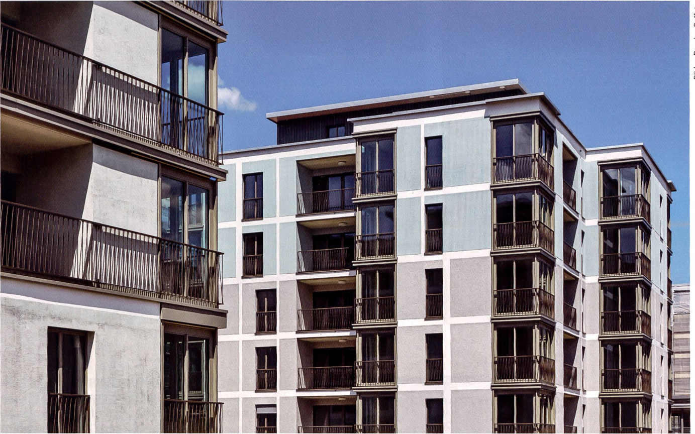
Duplex Architekten entwarfen für die fünf Häuser der BEP und die zwei Häuser der Sammelstiftung Nest ein einheitliches Erscheinungsbild.