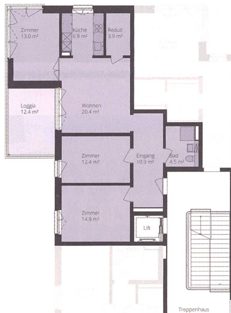
Grundriss einer Viereinhalbzimmerwohnung mit 87 Quadratmetern Wohnfläche und einer 12,4 Quadratmeter grossen Loggia.

kon (siehe Box) und liegt nur wenige Gehminuten vom Bahnhof Dietikon und rund 15 Zugminuten vom Zürcher Hauptbahnhof entfernt. In zwei ausserordentlichen Generalversammlungen stimmten die Genossenschaftsmitglieder 2011 dem Kauf des Rüchlig-Areals und des benachbarten Grundstücks der Fincasa AG zu. 2013 wählten die beiden Baupartner das Siegerprojekt aus, der Spatenstich fand im Sommer 2017 statt. Im August 2019 zogen die ersten Mieter ein.