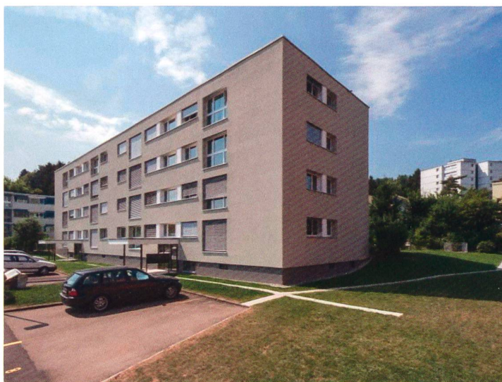
Gesamtsanierung MFH Am Brunnenbächli in Zollikerberg

Liegenschaftsanalysen Generalplanungen Bauleitungen