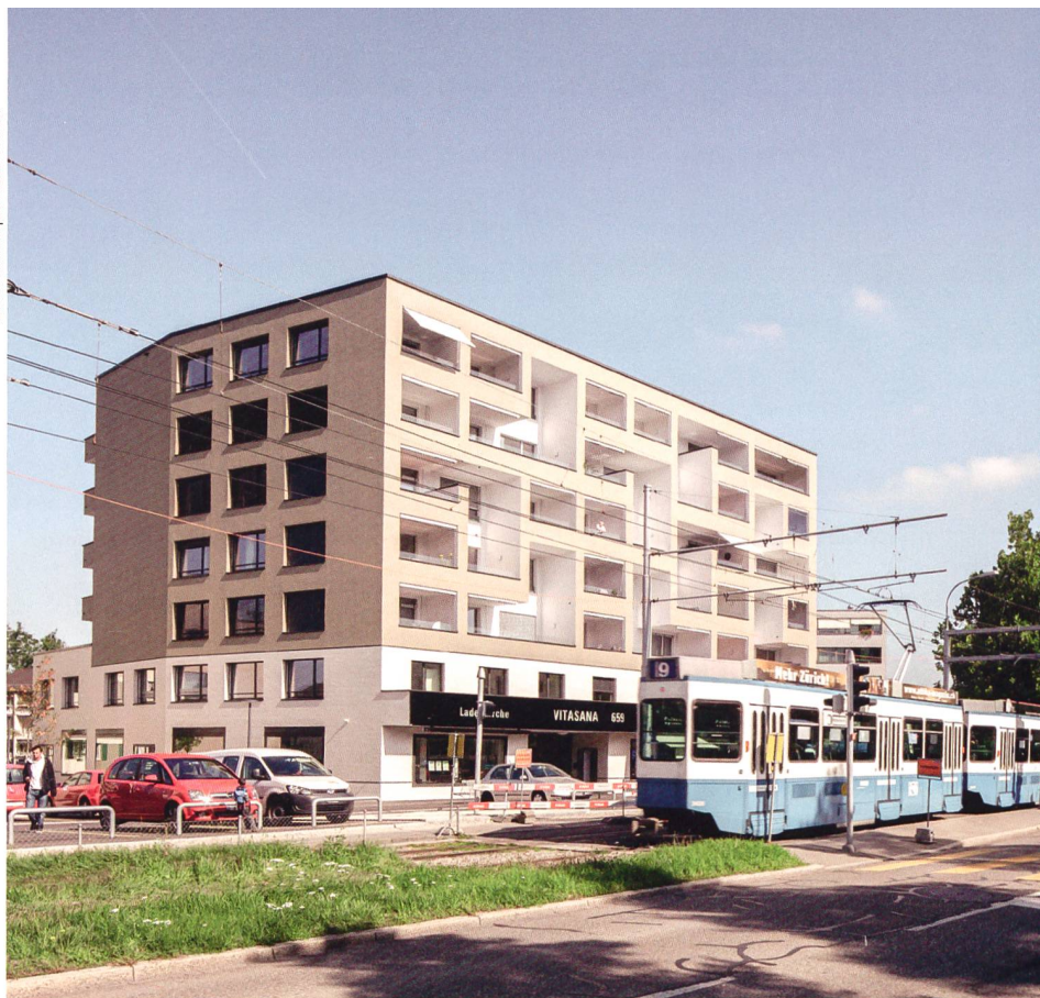
Der Kopfbau an der Luegislandstrasse bildet das markante Gesicht des erneuerten Ensembles. In den zwei Sockelgeschossen sind Gewerbenutzungen und Büros untergebracht.

ge Bauten aus den frühen 1950er-Jahren, deren Form mit den drei Flügeln an ein T-Shirt gemahnt. Sie galt es zu erhalten und instand zu setzen. Die sechs neuen Häuser besetzen die Ränder des Gevierts und bilden sozusagen einen Rahmen für die markanten Altbauten, die darin geometrisch verdreht wie Fliegerstaffeln stehen. «Wir wollten keine geschlossene Figur bauen», erklärt Architekt Andreas Galli. Vielmehr sei es darum gegangen, mit einer durchlässigen Bebauung die Tradition der Garten-