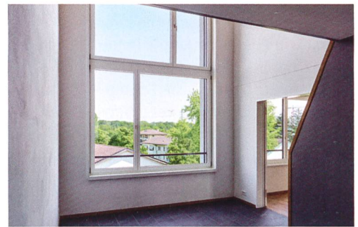
Die Vielfalt der Wohnungen umfasst auch überhohe Räume mit Galerien, die über eine Sambatreppe erreichbar sind.

stadt zu bewahren und die Siedlung mit der heterogenen Umgebung zu verknüpfen.