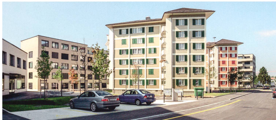
Drei Wohntürme aus den 1950er-Jahren blieben erhalten. Links: Neubauten der Etappe Süd.