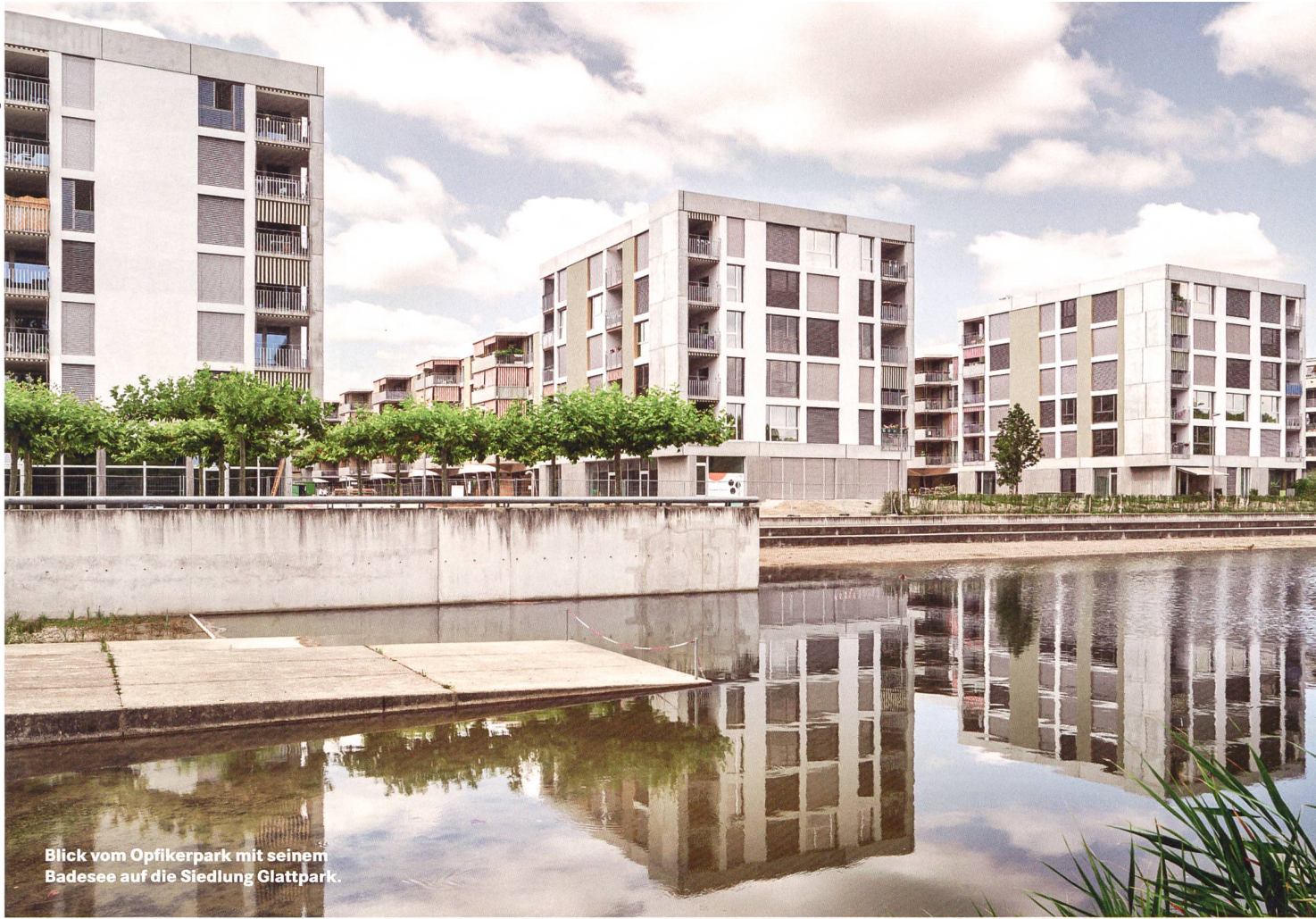
Blick vom Opfikerpark mit seinem Badesee auf die Siedlung Glattpark.

ABZ stellt Siedlung Glattpark in Opfikon (ZH) mit rund 300 Wohnungen fertig