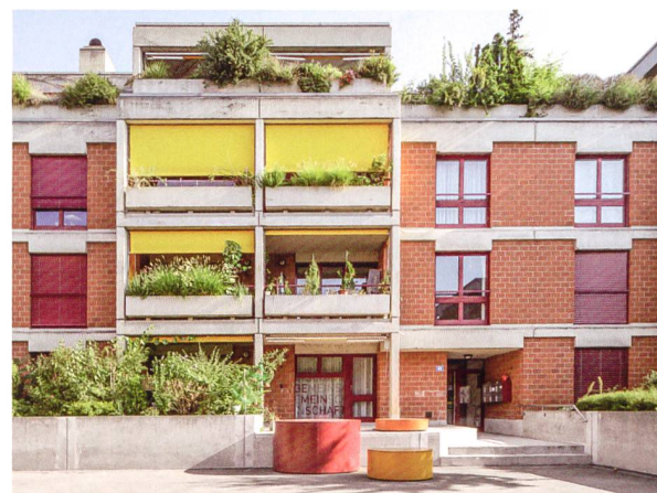
... aber auch bei Sanierungen wie der Winzerhalde, bei der unter anderem die Wärmeversorgung für Heizung und Warmwasser vollständig auf Fernwärme umgestellt wurde.

Der ursprüngliche Plan sah vor, dass alle Kantone zumindest das Basismodul integral bis spätestens 2020 einführen. Doch das ganze Vorhaben ist ins Stocken geraten. Bis jetzt haben erst die Kantone Basel-Landschaft, Basel-Stadt, Luzern, Obwalden, Jura und Waadt die aktuellen MuKen umgesetzt. Im Wesentlichen halten sich diese Kantone wie empfohlen an das Basismodul. Basel-Stadt geht in einigen Punkten sogar darüber hinaus – während das Basismodul beim Ersatz von Heizungen einen Anteil von mindestens zehn Prozent erneuerbarer Energie fordert, sind es in Basel-Stadt zwanzig Prozent. Weiter zeichnet sich ab, dass einzelne Kantone gewisse Abweichungen oder Sonderregelungen umsetzen. Luzern setzte ein neues Energiegesetz in Kraft, das auch Lösungen mit Biogas für zulässig erklärt. Ein grosser Rückschlag war es allerdings, als die entsprechenden Vorlagen in den Kantonen Solothurn und Bern in der Volksabstimmung scheiterten.