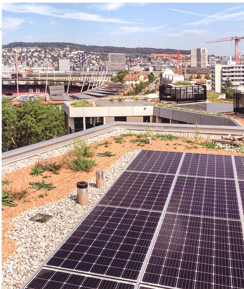
Die Siedlungsgenossenschaft Eigengrund geht wie andere Baugenossenschaften freiwillig über die Vorgaben der MuKen hinaus. Sie setzt wo immer möglich auf erneuerbare Energien – bei Neubauten wie dem Ersatzbau Letziggraben, der unter anderem PV-Anlagen und Wärmepumpen nutzt und die Anforderungen Minergie-P-Eco sowie SNBS erfüllt...