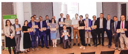
Das Netzwerk Housing Europe würdigte das Engagement von hundert Organisationen, die sich für den gemeinnützigen Wohnungsbau einsetzen, darunter WBG Schweiz.

Wir sind nicht die Einzigen, die dieses Jahr den hundertsten Geburtstag feiern. Dass vor rund hundert Jahren in ganz Europa eine starke Bewegung für den genossenschaftlichen und sozialen Wohnungsbau entstand, zeigte sich eindrücklich am «International Social Housing Festival» unseres europäischen Netzwerks Housing Europe. Im Rahmen des Festivals, das im Juni in Lyon stattfand, lud Housing Europe zu einer ganz speziellen Feier. Unter dem Titel «100 housing providers celebrate 100 years of social housing» wurden hundert Organisationen aus ganz Europa, die seit einem Jahrhundert oder mehr für den sozialen, öffentlichen oder genossenschaftlichen Wohnungsbau tätig sind, gewürdigt. Zwanzig Jubilare präsentierten ihre Organisation und ihre Vision für die