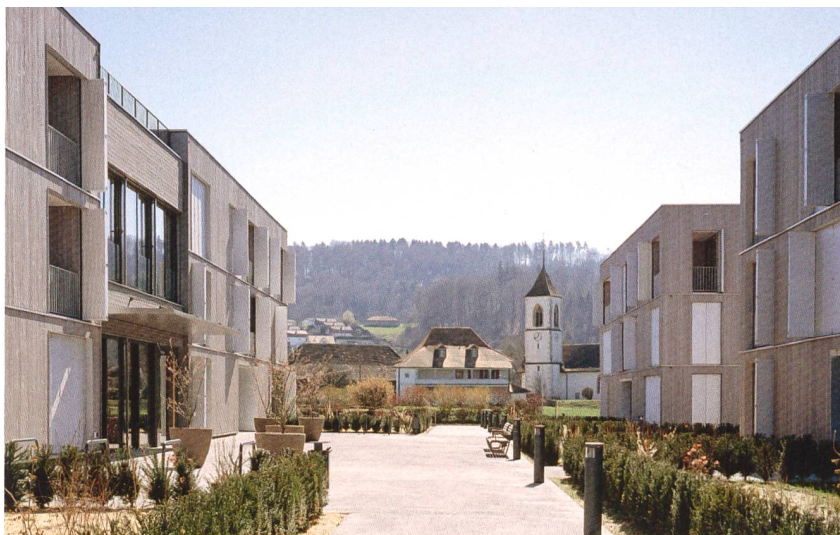
Die Häuser mit ihren Fassadenverkleidungen aus Holz fügen sich ins Dorfbild.