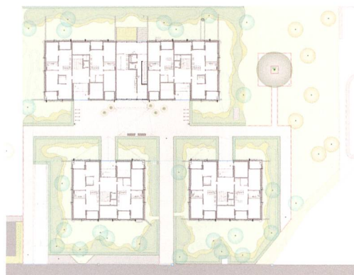
Situation der vier neuen Häuser.