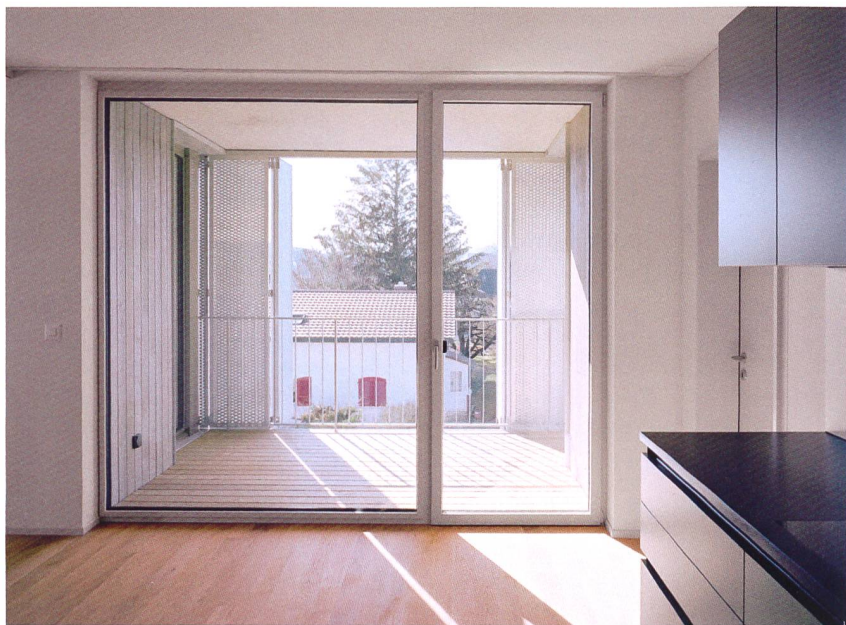
Die Wohnungen bieten Eigentumsstandard.

hochwertigen Küchengeräten und barrierefreien Badezimmern entspricht demjenigen von Eigentumswohnungen.