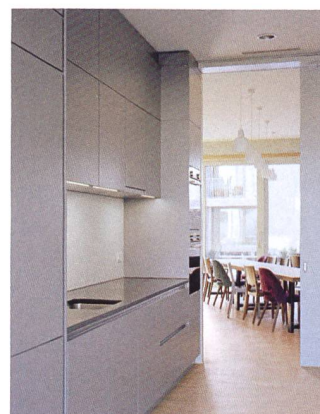
Der «Treffpunkt» ist in unterschiedliche Bereiche gegliedert.