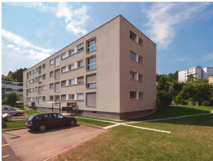
Gesamtsanierung MFH Am Brunnenbächli in Zollikerberg

Liegenschaftsanalysen Generalplanungen Bauleitungen