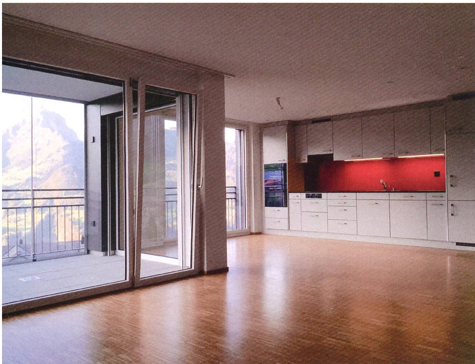
Die Rosengärtli-Wohnungen bieten zeitgemässen, hindernisfreien Komfort. Die Terrassen sind mit Glasschiebewänden ausgerüstet.