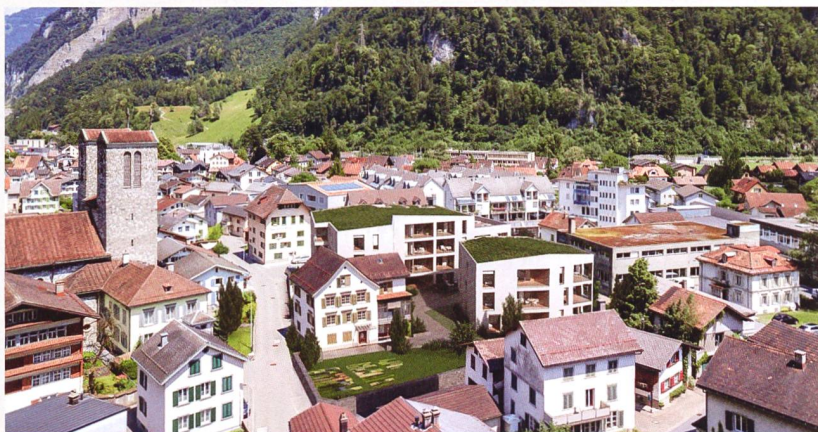
Fotomontage des Projekts «Lunde» im alten Dorfkern von Netstal. Die beiden Neubauten (grüne Dächer) sind in der Bildmitte, links vom vorderen Neubau befindet sich das Haus Lunde, das erhalten bleibt.

Im alten Dorfkern von Netstal kann die GAW ein Grundstück von rund 2700 Quadratmetern von der Gemeinde Glarus im Baurecht übernehmen. Die Behörden hatten die Parzelle für den sozialen Wohnungsbau reserviert und unter gemeinnützigen Trägern ausgeschrieben. Die GAW klärte erst den Bedarf für Alterswohnraum im Ort ab und führte dann einen Projektwettbewerb durch. Ihr Vorschlag überzeugte den Gemeinderat, der Baurechtsvertrag nahm am 14. Juni 2019 die Hürde der Gemeindeversammlung. Das Areal im histori-