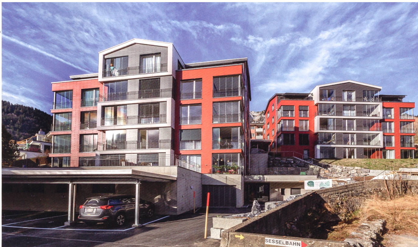
Der jüngste Neubau der Genossenschaft Alterswohnungen Linth stammt von 2017. Auf der Sonnenterrasse in Amden erstellte sie zwei Häuser mit 26 altersgerechten Wohnungen.

Die Genossenschaft Alterswohnungen Linth (GAW) ist mit erfolgreichem Konzept auf Wachstumskurs