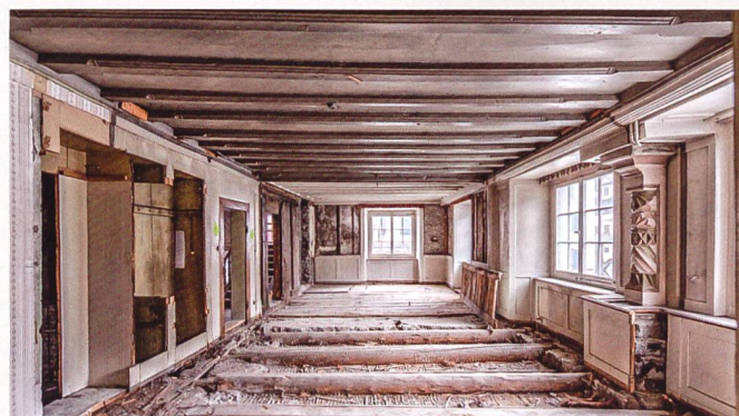
Im Dorfkern von Näfels will die GAW die beiden historischen Häuser in der Beuge erhalten und als Alterswohnraum nutzen. Sie stammen aus dem 16. Jahrhundert, die Grundsubstanz geht gar auf 1415 zurück. Besonders die Innenräume sind nur wenig verändert worden.

Auch im Zentrum von Näfels wird die GAW einen wichtigen Beitrag zum Erhalt alter Bausubstanz leisten: Sie hat in der Beuge eine Hauszeile erworben, die zwei der ältesten Bauten im Ort umfasst, deren Grundsubstanz auf 1415 zurückgeht. Das heutige Erscheinungsbild stammt von 1585 beziehungsweise 1545, ist also hundert Jahre vor dem bekannten Freulerpalast entstanden. Mit ihrer Konstruktion in Bohlenständerbauweise oder den kaum veränderten hohen Räumen mit den alten Böden sind sie einzigartige Bau- und Wohnzeu- gen. Hier