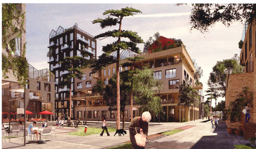
In Oberbillwerder entsteht ein neuer Stadtteil mit 7000 Wohneinheiten und 5000 Arbeitsplätzen. Hier setzt man insbesondere auf das Modell der Baugemeinschaft.

Im Zentrum dieses Modellversuchs steht, dass attraktive Wohnungen mit guter Architektur