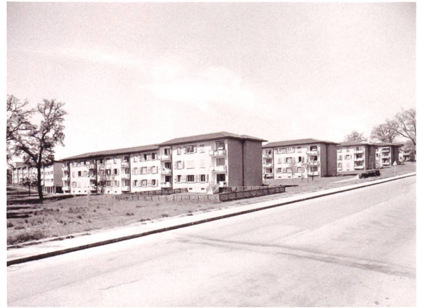
1921 baute die SCHG am Chemin des Sports ihre erste Gartenstadtsiedlung mit 52 Reihenhäuschen (links). Rechts die Cité Villars in den 1930er-Jahren. Das Herzstück der SCHG, das Gebiet Cité Villars-Vieuses-Franchises, wird derzeit vollständig umgestaltet.