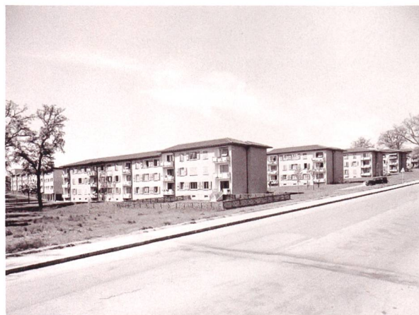
1921 baute die SCHG am Chemin des Sports ihre erste Gartenstadtsiedlung mit 52 Reihenhäuschen (links). Rechts die Cité Villars in den 1930er-Jahren. Das Herzstück der SCHG, das Gebiet Cité Villars-Vieuses-Franchises, wird derzeit vollständig umgestaltet.