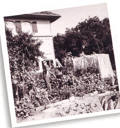
Die Gärten sind wichtiger Bestandteil des Weisssteinquartiers. Undatierte Fotografie (vor 1969).