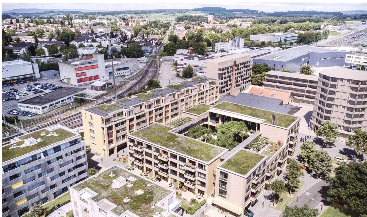
Auf dem Kälinaareal im Quartier Hegmatten in Oberwinterthur entwickelt die Baugenossenschaft mehr als wohnen ihre zweite nachhaltige Siedlung mit Wohnraum für 400 Menschen sowie vielfältigen Quartierangeboten.

Die Genossenschaft mehr als wohnen, die auf dem 2014/15 bezogenen Hunzikerareal in Zürich eine vielbeachtete Wohnsiedlung realisiert hat, wagt sich mit ihrem zweiten Projekt nach Oberwinterthur. An einer ausserordentlichen GV Ende November stimmten die Mitglieder grossmehrheitlich dem Kauf des Kälinaareals zum Preis von 37,5 Millionen Franken sowie einem Projektkredit von 73,5 Millionen Franken zu. Auf dem Gelände des ehemaligen Hobelwerks im Quartier Hegmatten mit einer Fläche von rund 15 300 Quadratmetern ist nachhaltiger Wohnraum für rund 400 Personen vorgesehen. Entstehen soll wiederum ein lebendiges und nachhaltiges Kleinquartier mit neuen Wohnformen, vielfältigen Quar-