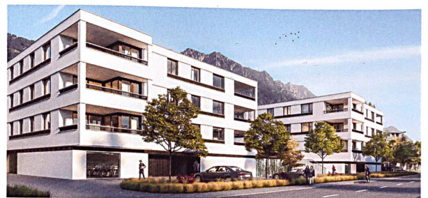
Projekt von Vogt Architekten AG für die zweite Siedlung der Wohnbaugenossenschaft Liechtenstein in Eschen.

Genossenschafter weniger Wohnraum pro Person und leisten somit ihren Beitrag zu einem ressourcenschonenden Umgang mit dem zur Verfügung gestellten teuren und knappen Bauland in Liechtenstein. Geplanter Baubeginn ist Februar 2019, der Bezug ist auf 2020 terminiert.