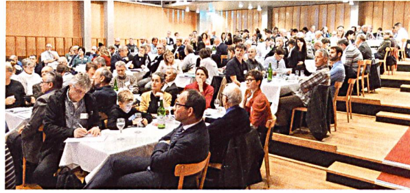
Die diesjährige Fachtagung der Grenchner Wohntage befasste sich mit Modellvorhaben.

Die Aufwertung und Weiterentwicklung von Wohnquartieren kam anhand der Beispiele der Neupositionierung des Morenal-Quartiers in Bellinzona (einer ehemaligen WEG-Siedlung, die jetzt einer Anlagestiftung gehört) und der auf Baurechtsland der Stadt Biel liegenden Genossenschaftssiedlungen zur Sprache. Dass der Eigenheimtraum oft nur für eine begrenzte Zeit funktioniert, weil sich die Wohnbedürfnisse im Lebenslauf ändern, zeigten Überlegungen des Hauseigentümerge-