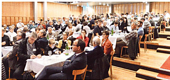
Die diesjährige Fachtagung der Grenchner Wohntage befasste sich mit Modellvorhaben.

Die Aufwertung und Weiterentwicklung von Wohnquartieren kam anhand der Beispiele der Neupositionierung des Morenal-Quartiers in Bellinzona (einer ehemaligen WEG-Siedlung, die jetzt einer Anlagestiftung gehört) und der auf Baurechtsland der Stadt Biel liegenden Genossenschaftssiedlungen zur Sprache. Dass der Eigenheimtraum oft nur für eine begrenzte Zeit funktioniert, weil sich die Wohnbedürfnisse im Lebenslauf ändern, zeigten Überlegungen des Hauseigentümerge-