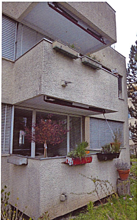
Auch die Balkons waren renovierungsbedürftig.