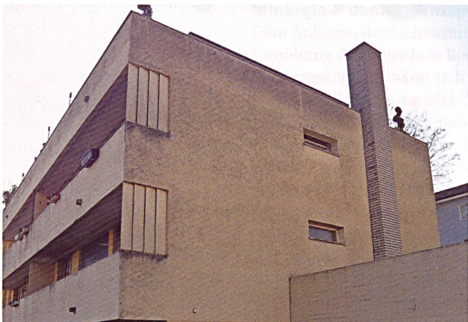
Die Fassade vor der Sanierung ...

Die Architekten von Choffat + Filipaj Architekten GmbH, Zürich, hatten den Auftrag, die Liegenschaft so zu erneuern, dass sie für mindestens 30 weitere Jahre unterhaltsarm weiterbetrieben werden kann. Wichtigste Massnahme dafür war die Dämmung der Gebäudehülle, inklusive Ersatz der Fenster. Damit lässt sich der Energieverbrauch massiv senken. Zugleich bringt die Neuerung mehr Komfort für die zuvor schwer heizbaren Wohnungen. Beim Material für die verputzte Aussenwärmedämmung setzten die Architekten auf