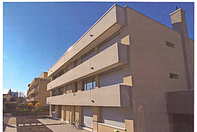
... und nach der Sanierung.