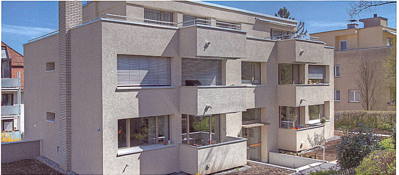
Das Mehrfamilienhaus am Schützenrain in Zürich wurde einer Gesamtsanierung unterzogen.

Nach 53 Jahren war es Zeit für eine Totalerneuerung: Mit einer neu gedämmten Gebäudehülle, neuen Fenstern und einer kompletten Innensanierung ist das Mehrfamilienhaus am Schützenrain in Zürich für die nächsten Jahrzehnte gerüstet.