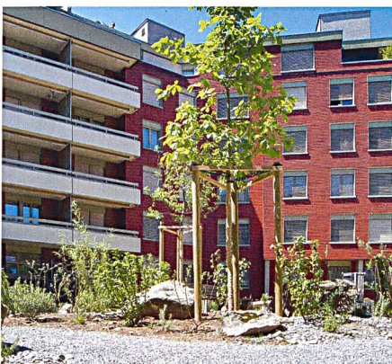
Die ABZ analysiert aktuell ihren Bestand. Viele Siedlungen wurden bereits ökologisch aufgewertet, kürzlich etwa der Rütihof in Zürich Höngg. Bis die Wildpflanzen sich entwickeln, braucht es noch Zeit.

das gelingt, zeigt die erste, 2009 naturnah umgestaltete SGE-Siedlung Glanzenberg in Dietikon (ZH). Eine Evaluation einige Jahre danach ergab, dass die Bewohnenden die naturnahe Gestaltung als Aufwertung empfinden und sich gerne draussen aufhalten.