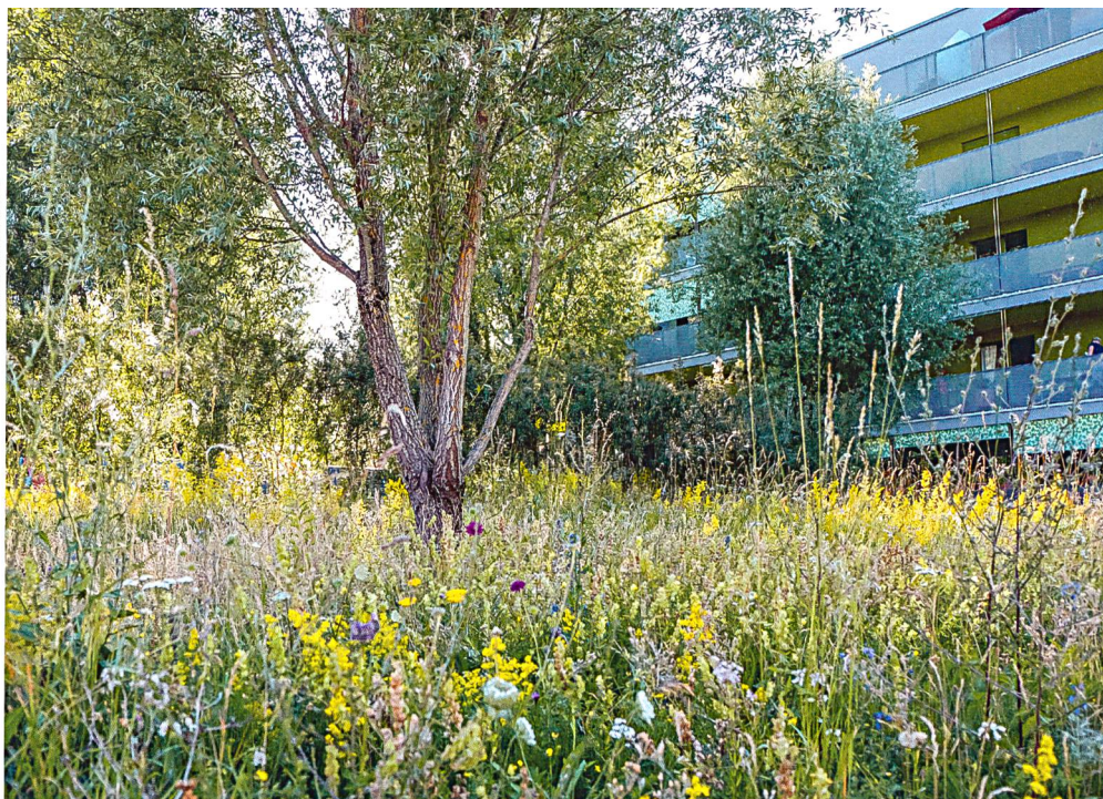
Bei den grossen Genossenschaften gehört die FGZ zu den Pionierinnen für naturnahe Aussenräume. Als beispielhaft gilt ihre Siedlung Brombeeriweg.