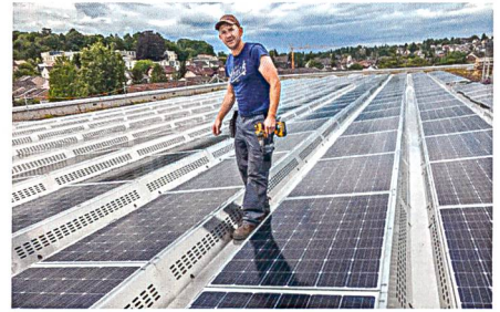
Heute ist es bereits günstiger, mit Photovoltaik Strom zu produzieren, als den Strom vom Energieversorger zu kaufen.