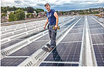
Heute ist es bereits günstiger, mit Photovoltaik Strom zu produzieren, als den Strom vom Energieversorger zu kaufen.