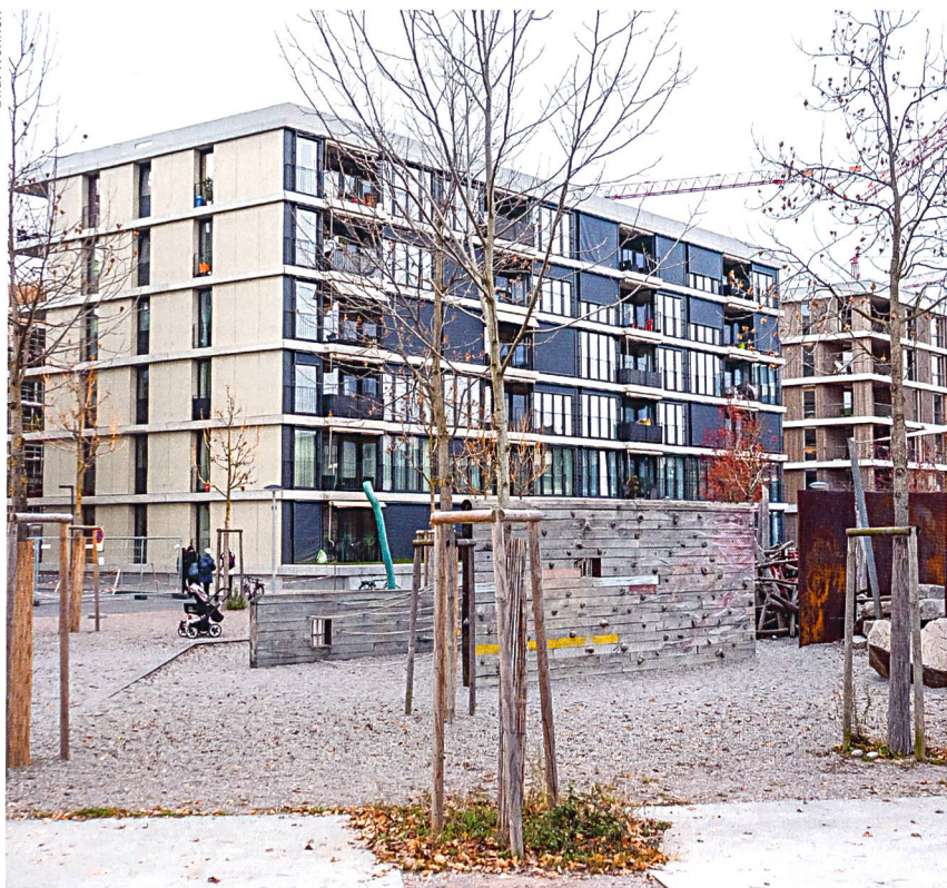
Auch das Haus der Sowag AG für sozialen Wohnungsbau ist auf die Anforderungen der 2000-Watt-Gesellschaft ausgerichtet. Während der Kern aus Beton besteht, sind die Aussenhüllen in einer mehrschichtigen Leichtbauweise ausgeführt. Treppen, Loggien, Balkone und Stützen wurden kostengünstig aus vorfabrizierten Elementen erstellt.