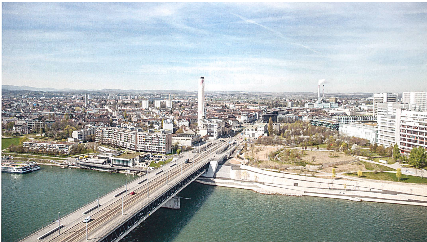
Blick von der Dreirosenbrücke auf das Quartier St. Johann mit dem Novartis Campus rechts im Vordergrund. Der stark industrialisierte Norden der Stadt Basel steht mitten in einem Transformationsprozess vom Gewerbe- hin zum Wohnquartier.

Regierungsrätin Eva Herzog will in Basel-Stadt mehr Wohnungen schaffen