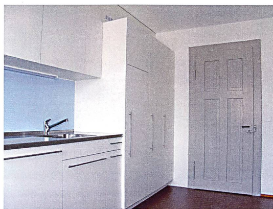
Durch eine Neuorganisation der Grundrisse konnte eine Wohnung hinzugewonnen werden.