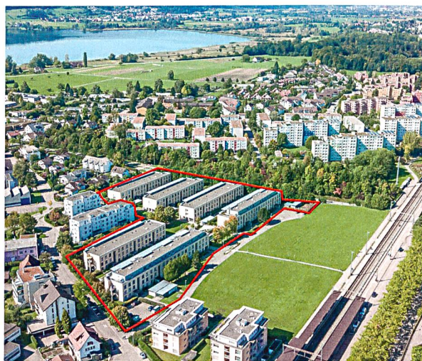
In Nänikon am Greifensee konnte die ASIG eine ganze Wohnsiedlung erwerben.

dem statutarischen Wohnrecht und der Kostenmiete. Die Mieten bleiben unverändert. Auch der langjährige Hauswart wird ins ASIG-Team aufgenommen.