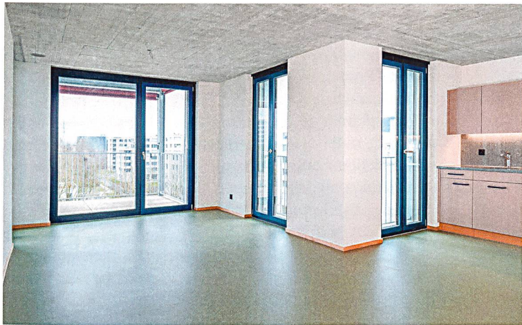
Die Farbgestaltung bei den Küchen und Linoleumböden sowie die Rohbetondecke prägen die neuen Alterswohnungen.

Siebzig günstige altersgerechte Wohnungen und eine Kindertagesstätte sind im März in Zürich Schwamendingen bezugsbereit geworden. Die Stiftung Alterswohnungen der Stadt Zürich (SAW) eröffnete die erste Etappe der Überbauung Helen Keller. Bis 2020 entstehen insgesamt 152 1½- bis 3-Zimmer-Wohnungen. Anstelle einer aufwändigen Sanierung der 1974 erstellten Altbauten entschied sich die Stiftung vor sechs Jahren für einen Neu-