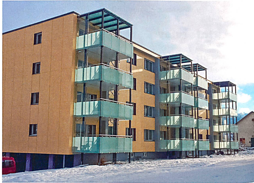
Die GdG hat in Wattwil (SG) ihre zweite Liegenschaft erworben.