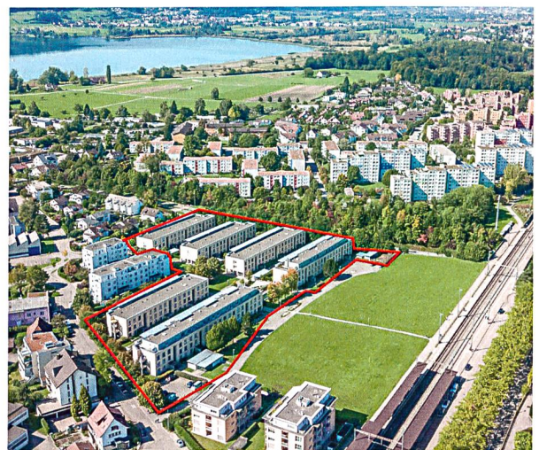
In Nänikon am Greifensee konnte die ASIG eine ganze Wohnsiedlung erwerben.

dem statutarischen Wohnrecht und der Kostenmiete. Die Mieten bleiben unverändert. Auch der langjährige Hauswart wird ins ASIG-Team aufgenommen.