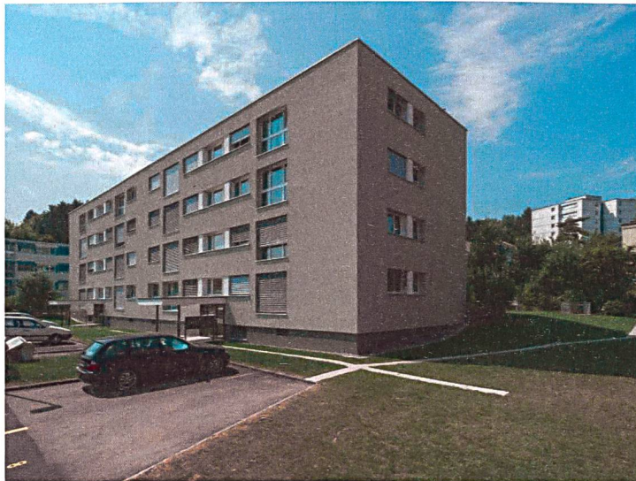
Gesamtsanierung MFH Am Brunnenbächli in Zollikon

Liegenschaftsanalysen Generalplanungen Bauleitungen