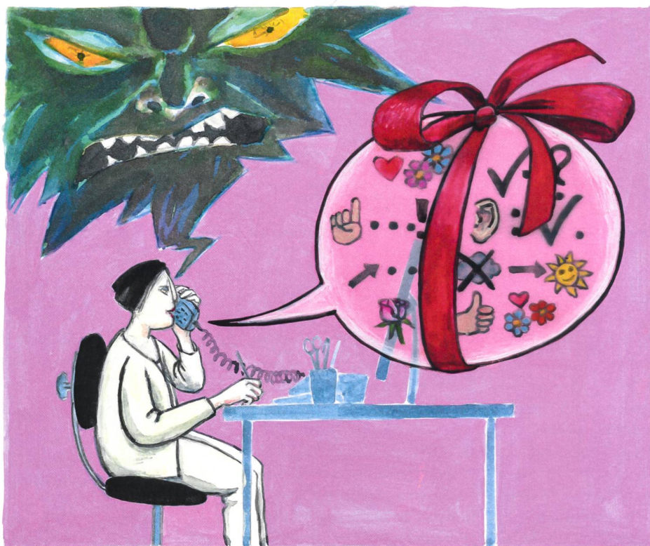
Illustration: Monika Zimmermann

Der alle zwei Jahre startende Finanzierungslehrgang ist 2018 wieder im Angebot, erweitert um ein Modul zur strategischen Finanzplanung. Der Managementlehrgang kommt das erste Mal nach Basel.