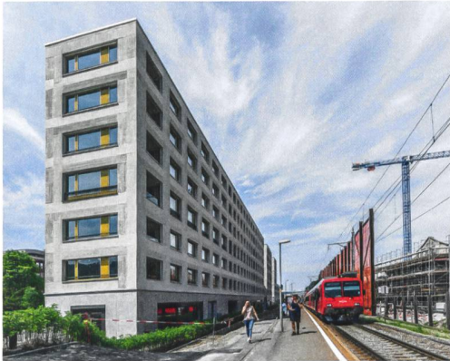
Genossenschaftsbau in der Greencity.