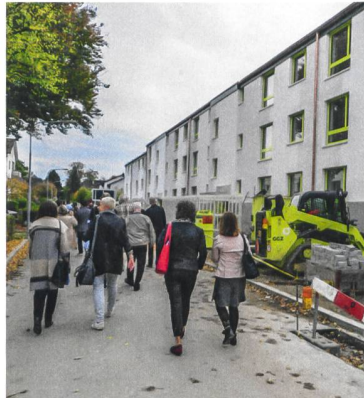
Siedlung Obsthalden: Reihenhausegefühl.

Fast im Monatstakt lädt der Regionalverband Zürich zur Neubaubesichtigung. So durften sich die Mitglieder am 8. September ein Bild der Greencity machen. Im neuen Quartier auf dem Areal der ehemaligen Papierfabrik Sihl in der Manegg erstellten Gemeinnützige Bau- und Mietergenossenschaft Zürich, Genossenschaft Hofgarten, Wogeno Zürich sowie Stiftung Wohnungen für kinderreiche Familien insgesamt 230 Wohnungen; den Gewerbetreibenden bewirtschaften sie gemeinsam.