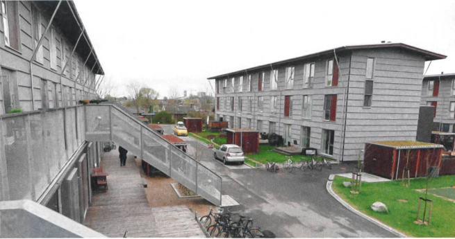
Die Siedlung Sundbygård ist ein Beispiel für einfaches, vorgefertigtes Bauen.