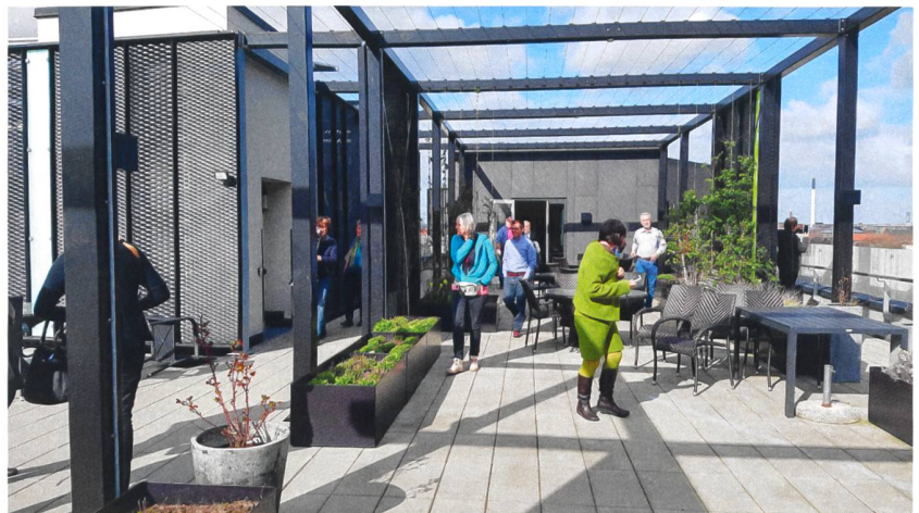
Pflegeheime in Dänemark wirken sehr wohnlich. Sie setzen auf Individualität, Aktivität, aber auch auf eine gute Verpflegung. Dienstleistungen, die auch Aussenstehende nutzen können, sorgen für Offenheit. Im Bild das Vorzeigeprojekt Pflegezentrum Lotte in Frederiksberg.

und in einzelnen Zeilen wandelten sich die Nutzungsformen. So finden sich dort jetzt auch eine Seniorenwohngemeinschaft, ein Pflegezentrum und eine Reha-Institution. Ein Laden, ein Restaurant, ein Kebab-Stand und besser nutzbare Aussenräume sowie Wohnungserweiterungen ergänzen das Angebot. Dank diesen Massnahmen herrscht wieder Vollvermietung.