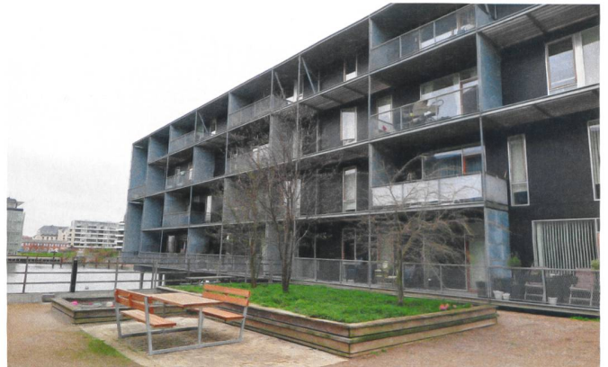
Zu Teglværkshavnen gehören auch ein Gemeinschaftshaus und ein Bootsanlegeplatz.

über eine Vielzahl von «Klubs» organisiert, in denen sich Dutzende von Aktivitäten entfalten. Die private Nutzung der Infrastruktur ist möglich, aber pro Haushalt begrenzt. Die Organisation besorgen Arbeitsgruppen und Verantwortliche, die an der Generalversammlung bestimmt werden. Wichtige Entscheidungen fällt die Versammlung. Für deren Vorbereitung und das Budget wählt diese einen Vorstand, der den Kontakt zum gemeinnützigen Bauträger «3B» sichert, dem die Seniorenwohngemeinschaft zugehört.