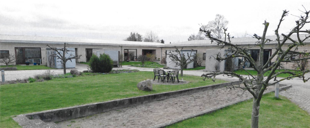
Die Seniorengemeinschaft Kløvermarken umfasst 19 Häuser und ein Gemeinschaftshaus. Die Gemeinschaftsflächen verwalten eine Vielzahl von «Klubs».

Beim Thema Demokratie lohnt es sich, zurückzukommen auf die Seniorenwohngemeinschaft in Måløv. Sie heisst Kløvermarken (Klee-feld) und umfasst 19 Häuser sowie ein Gemeinschaftshaus unter anderem mit Küche, Saal, Gästezimmer und Werkstatt. Die gemeinschaftlichen Nutzungen machen 25 Prozent der Fläche aus, was bei der Vermietung auch separat ausgewiesen wird. Die Bewohner wissen somit sehr genau, dass sie einen Teil der Miete für Gemeinschaftsflächen zahlen. Deren Nutzung ist