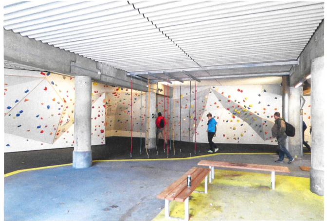
Die Aussenräume und Gemeinschaftseinrichtungen der Siedlung Farum Midpunkt sind kürzlich aufgewertet worden.

werben zu vermitteln, dass Nachbarschaftshilfe und die Übernahme von Verantwortung sehr erwünscht seien. Doch einen Zwang wolle und könne man nicht ausüben, weil die Auswahl der Neumieter nicht den Bewohnern zukommt.