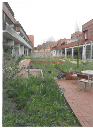
Die Grosssiedlung Farum Midpunkt aus den 1970er-Jahren bietet auf terrassierten Zeilenbauten über 1500 Wohnungen.