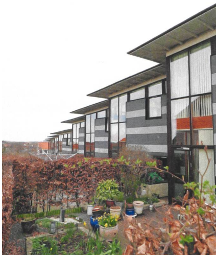
Die Überbauung Grønhøj mit ihren Sozialwohnungen ist Teil eines Quartiers, in dem sich Eigentums- und Wohnungstypen abwechseln.