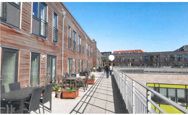
Das Langgadehus ist ein gutes Beispiel für die Durchmischung in dänischen Wohnsiedlungen: Im Sockel der Hofrandbebauung sind Pflegewohnungen, öffentliche Nutzungen und Gemeinschaftsräume untergebracht, im oberen Geschoss Familienwohnungen.