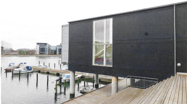
Die Überbauung Teglværkshavnen im umgenutzten Kopenhagener Südhafen bietet einen Mix von Eigentum und Sozialwohnungen, die sich äusserlich nicht unterscheiden.