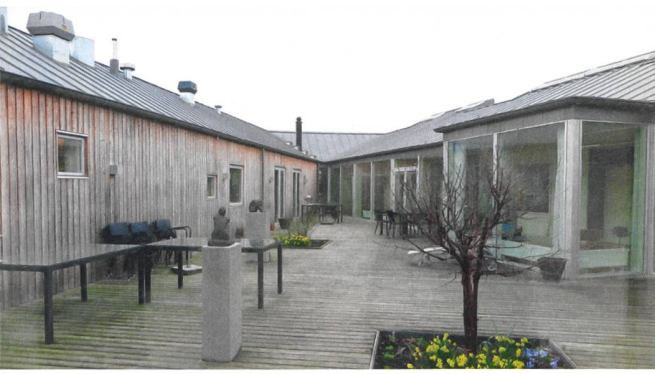
Das Sterbehospiz Søndergård in Måløv bietet freundlich gestaltete Räumlichkeiten und viel Natur.