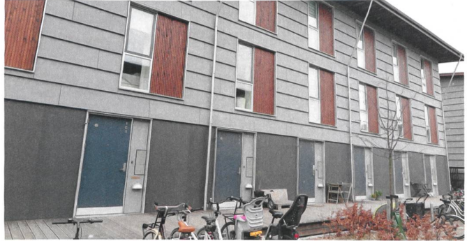
Kostenoptimiert wohnen: Man beachte die schmalen Reihenhäuser.

die Vorstädte Kopenhagens geprägt hat. Zu diesem Plan gehören insbesondere Siedlungen, die darauf abzielen, auch etwas für das kleine Portemonnaie anzubieten.