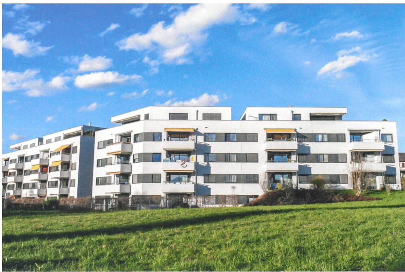
2010 konnte die attraktive Liegenschaft Schluechtstrasse mit 37 Wohnungen bezogen werden.