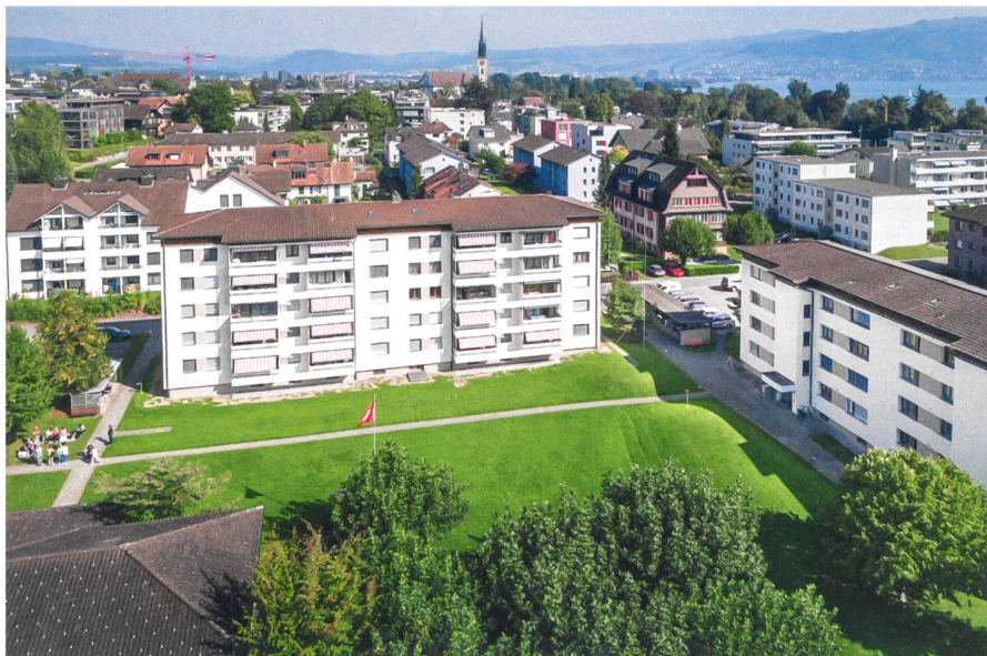
Luftaufnahme der Liegenschaft Enikerweg, die mit dem Eckneubau ergänzt wird. Die Tiefgarage entsteht unter der grossen Wiese. Der grosszügige Innenhof wird anschliessend neu gestaltet und bleibt so als Freiluftgemeinschaftsraum erhalten.