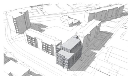
So wird der Zwischenbau (grau) die beiden bestehenden Häuser verbinden.

fegegossenschaft auf gemeinnütziger Basis. Die am 3. Februar 1964 aus der Taufe gehobene Gemeinnützige Baugenossenschaft Cham war denn politisch auch breit abgestützt und genoss die Unterstützung des Gewerbes – beides gilt bis heute.