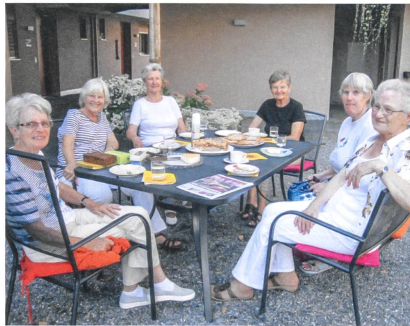
Die GBC-Anlässe in den Altersliegenschaften sind gut besucht. Im Bild: fröhliche Kaffeerunde mit selbstgebackenem Kuchen in der Liegenschaft Mugerenstrasse.

gute Stimmung unter den Mietern. Zu verdanken sei dies auch dem grossen Engagement der Geschäftsführerin, die nicht nur organisatorisch wirke, sondern den persönlichen Kontakt mit den Mieterinnen und Mietern pflege.