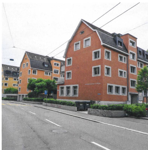
So präsentiert sich die Überbauung der Baugenossenschaft Wiedikon an der Steinstrasse. Im Zuge der Renovation von 2013 erneuerte man auch die Aussenräume.