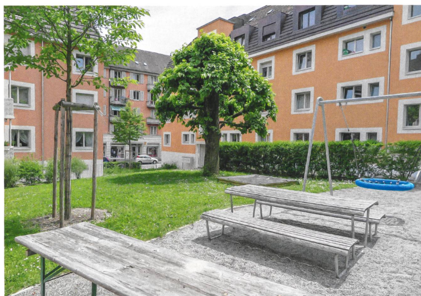
Die Kiesplätze waren ursprünglich Wäscheaufhängeplätze. Dank neuer Möblierung und Bepflanzung mit Schattenbäumen sind sie heute attraktive Aufenthaltsorte.