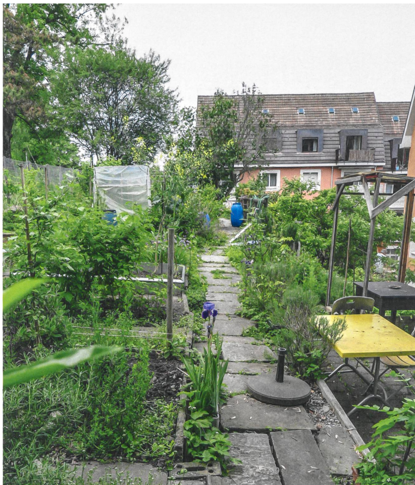
Die Nutzgärten an der Böschung über der Siedlung blieben erhalten.

Ein Kritikpunkt, der auch von einem Bewohner vor Ort eingebracht wird. Sonst aber gefalle ihm und seiner Familie die Neugestaltung. «Wir haben es nicht so mit Schickimicki. Wir fühlen uns wohler, wenn es ein bisschen natürlich ist.» Hier sind jedoch nicht ganz alle der gleichen Meinung. Als «schrecklich» bezeichnet eine ältere Bewohnerin das hoch gewachsene Gras auf Nachfrage. Und erzählt wenige Sätze später: «Gestern habe ich mir aber erlaubt, vor dem Haus ein paar «Margritli» für einen Blumenstrauß zu pflücken.» Etwas, was vor wenigen Jahren noch nicht möglich gewesen wäre. ■