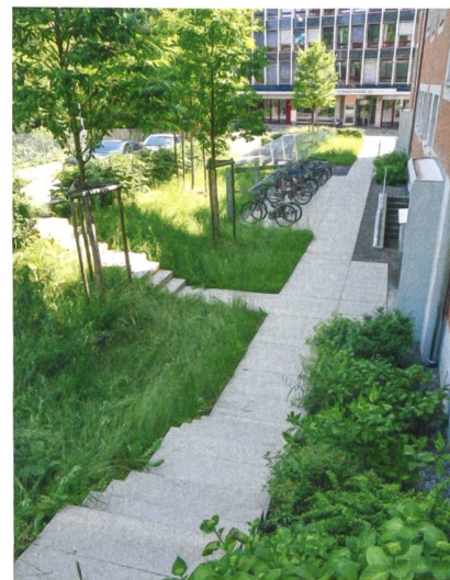
An den Hausmauern und in den Eingangsbereichen wurden Inseln mit Stauden und Kleingehölzen gepflanzt. Sie strukturieren den Aussenraum.