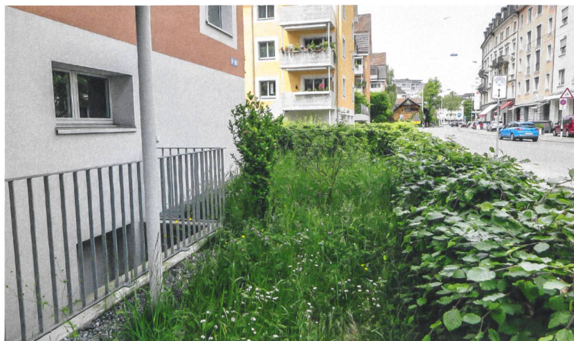
Eine niedrige Sockelmauer mit dahinterliegender Rotbuchenhecke grenzt die Siedlung von der Strasse ab. Die Hecke wie auch die Blumenwiese dahinter sind bewusst der Natur überlassen und werden nur selten geschnitten.

Wiedikon. Sechs Liegenschaften mit Baujahr 1930 besitzt sie an der Steinstrasse und der Ausstrasse im Zürcher Kreis 3. Wie zu jener Zeit üblich, sind die Bauten quer zur Strasse gestellt, doch findet sich zwischen den Hauszeilen für städtische Verhältnisse viel Grün. Rasenflächen, einige hohe Linden, Kiesplätze, ein Spielplatz, Nutzgärten hinter den Häusern – so präsentierte sich die Überbauung noch vor wenigen Jahren. Ein Aussenraum, der – abgesehen von den Gärten – bis zu diesem Zeitpunkt nur von wenigen Bewohnenden wirklich genutzt wurde.