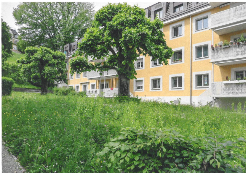
Eine grössere Rasenfläche zwischen den Gebäuden wurde zur Blumenwiese umgestaltet.