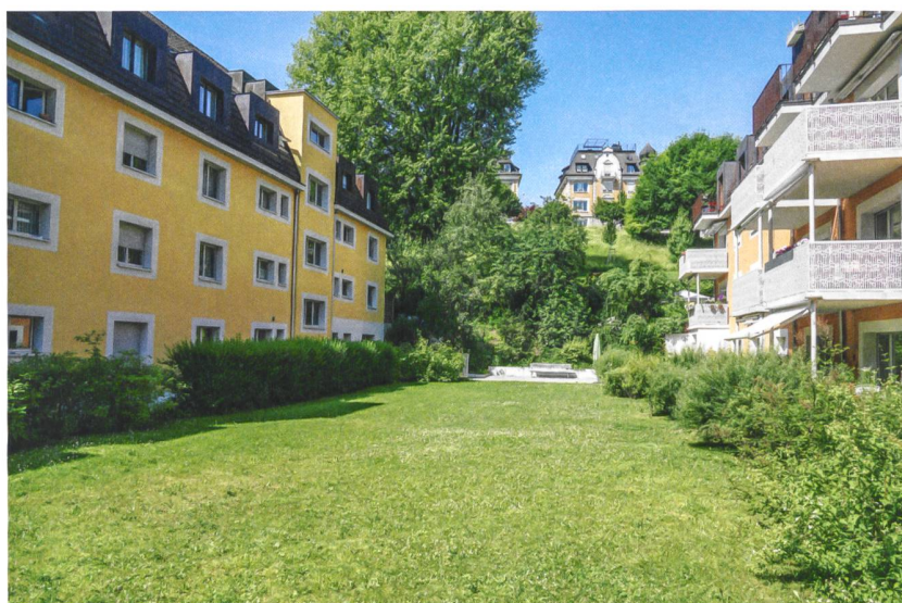
Sträucher kommen als «Abstandsgrün, das Abstand schafft» auch bei den Spielwiesen zum Einsatz und trennen die Sitzplätze vom gemeinschaftlichen Raum.