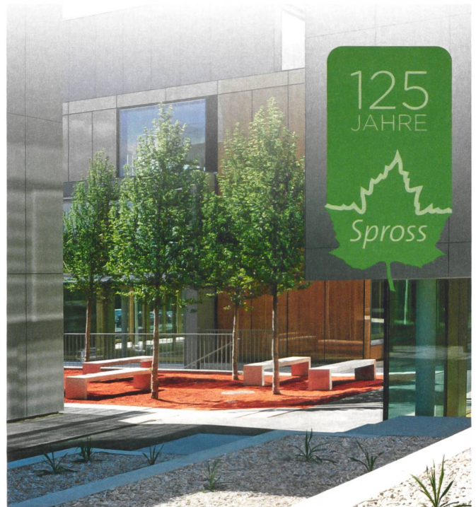
Spross Ga-La-Bau Projekt Zürich Seewürfel

wertbaren Bauabfälle steht seit 2001 das eigene, an Zürichs Hohlstrasse gelegene Abfallannahme- und Sortierwerk Debag mit eigenem Bahnanschluss zur Verfügung.