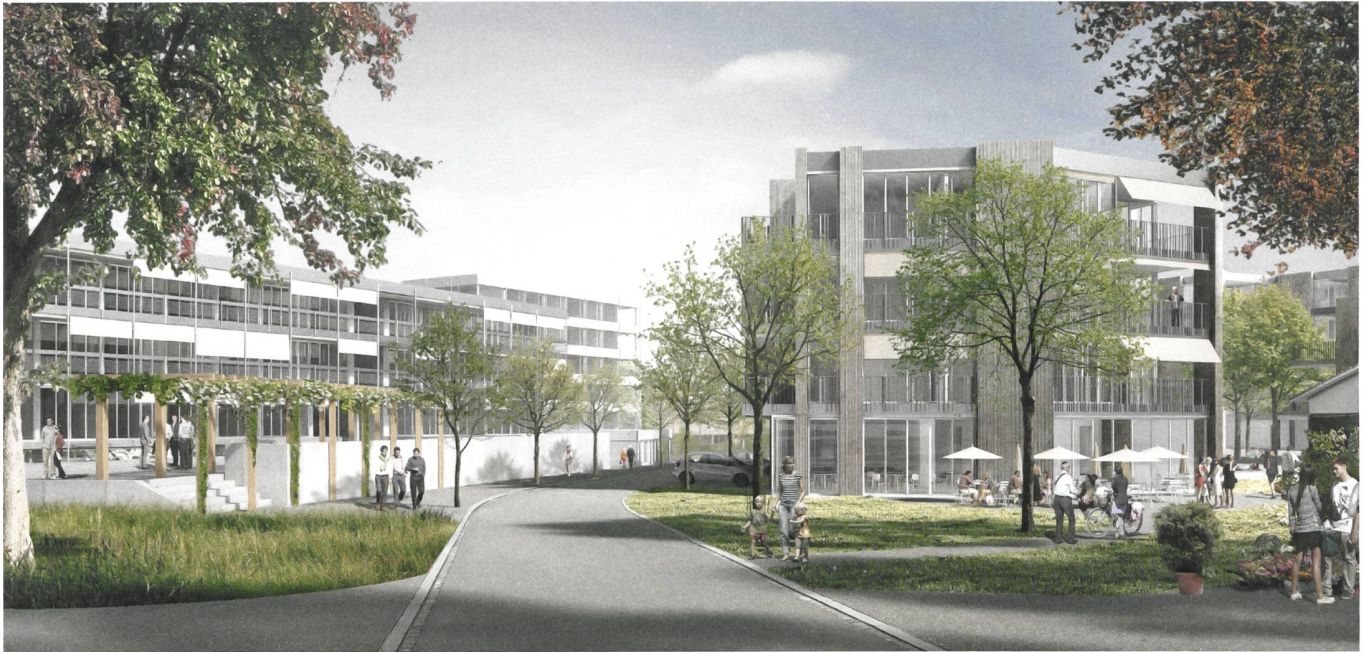
So wird sich der alte Dorfkern von Mägenwil dereinst präsentieren.

Nur selten wagen Genossenschaften den Sprung über die Kantonsgrenzen. Genau dies tut nun die Baugenossenschaft Frohes Wohnen, die heute Siedlungen in Zürich, Geroldswil und Urdorf besitzt. Sie konnte in der Gemeinde Mägenwil (AG), knapp dreissig Bahnminuten von Zürich entfernt, zwei Grundstücke erwerben, auf denen rund hundert Wohnungen entstehen. Die Genossenschaft überbaut damit den Grossteil des Areals «Sandfoore», das Teil eines Aufwertungsprojekts der Gemeinde ist. Die Eigentümerfamilie und eine Privatunternehmung, die Gewerberäume übernimmt, sind Partner.