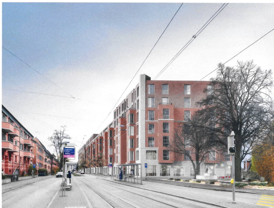
Das Atelier Abraha Achermann entschied den Architekturwettbewerb für sich. Die Jury lobte den städtischen Ausdruck der Neubauten.