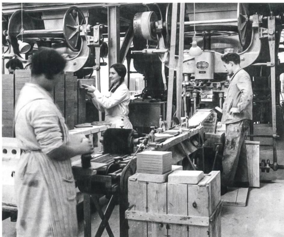
So stellte man 1934 in Laufen Keramikfliesen her.

Man schrieb das Jahr 1892. Am 4. Juli fand im Gasthaus Lamm in Laufen das Gründungstreffen der «Tonwarenfabrik Laufen AG» statt. Viele Jahre produzierte das Unternehmen Ziegel- und Backsteine, boten die natürlichen Lehmvorkommen in der Region, die verfügbare Wasserkraft und die Eisenbahn doch ideale Voraussetzungen. In den Boomzeiten der goldenen 1920er-