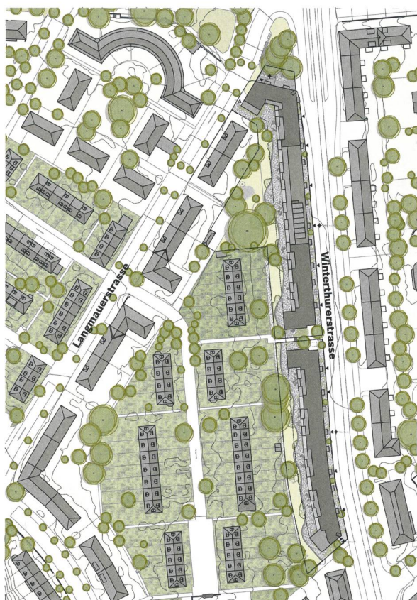
Die beiden Neubauten erstrecken sich entlang der stark befahrenen Winterthurerstrasse. Auf der Rückseite grenzen sie an einen ruhigen Innenbereich mit denkmalgeschützten privaten Reihenhäusern und Gärten.

Das Projekt wird derzeit hinsichtlich seiner Höhe überarbeitet. Der Ersatzneubau wird anstelle der 70 Altwohnungen etwa 120 neue Einheiten bieten, davon gut die Hälfte mit drei oder dreieinhalb Zimmern. Dies hatte die BGO verlangt, weil sie grossen Bedarf hat an attraktiven Wechselwohnungen für Mieter, deren Kinder ausgezogen sind. Daneben sind in geringerer Zahl auch Zwei- und Zweieinhalbzimmerwohnungen vorgesehen sowie grosse Familienwohnungen. Auf dem Dach ist eine gemeinschaftliche Terrasse geplant. Entlang der Winterthurerstrasse werden im Parterre des Weiteren Flächen für Gewerbe, eine Kinderkrippe und die Geschäftsstelle der Genossenschaft entstehen. Baubeginn ist voraussichtlich im Jahr 2020, die Erstellungskosten werden derzeit auf rund 80 Millionen Franken geschätzt.