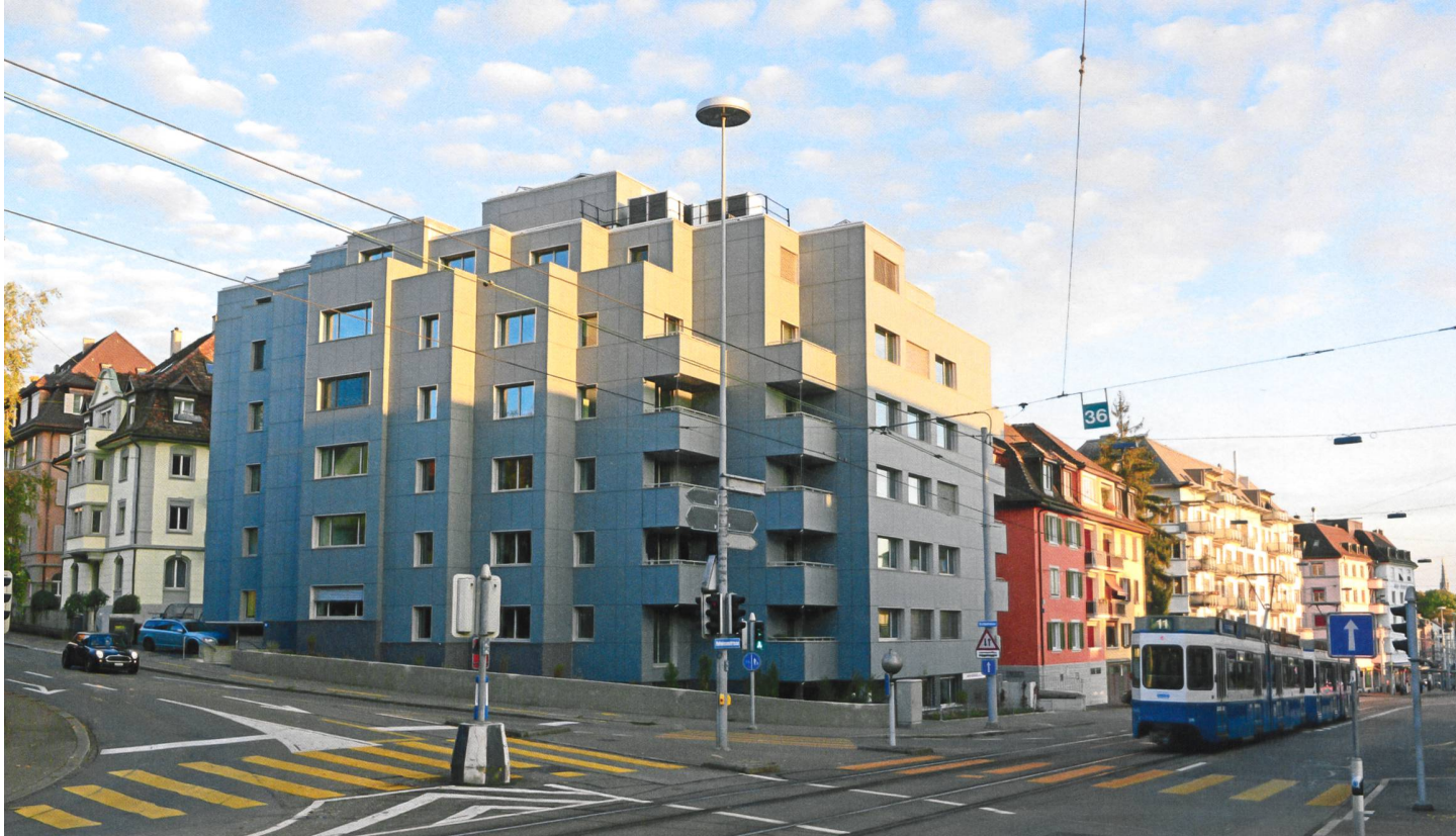
Das Mehrfamilienhaus an der Hofwiesenstrasse in Zürich erhielt im Rahmen eines Umbaus eine neue Fassade mit integrierten Photovoltaikzellen. Dabei war das Erscheinungsbild ein wichtiges Thema: Auf die Rückseite des Aussenglases wurde mittels digitalen Glaskeramikdruckes eine Farbe angebracht.

Gebäudeintegrierte Photovoltaik besitzt grosses Potenzial