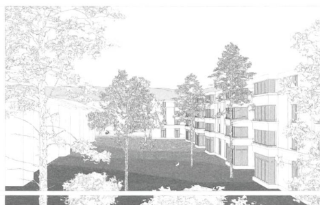
Impression des Wohngefühls in der Neubausiedlung.

Vorschlag für das Baufeld 7. Sie platziert dort zwei Punkthäuser mit 34 mehrseitig ausgerichteten Grossraumwohnungen. Die Kombination von zwei Projekten ergibt gemäss Jury mehr als die bloße Summe ihrer Wohnbauten: Einerseits bereichert sie die Vielfalt und die Identifikation im Quartier, und andererseits ergibt sie für die Baugenossenschaft Waidmatt einen Mehrwert in Form eines vielfältigen Wohnangebots.