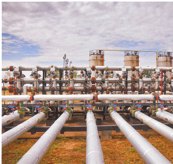
Beim Erdgas ist der Hauseigentümer an einen Lieferanten gebunden.

Die Investition für die Installation einer Öl- oder Gasheizung ist in